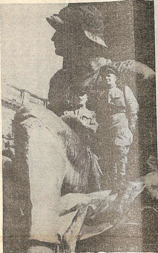
Цьому знімку майже півстоліття. На ньому сфотографований професор Георгій Архипович Саранча, тодішній військовий лейтенант разом із своїм бойовим другом Федором Кудінін. Було це в Берліні 9 травня 1945 року біля пам'ятника Вільгельму. Ця фотографія, яку зняв тоді військовий кореспондент збирається в Берліні-Карлсхорсті, в музеї Історії безвідмовної капітуляції фашистської Німеччини. В залі цього музею 8 травня 1945 року був підписаний акт беззасторожної капітуляції вермахту фашистської Німеччини. Із співробітниками цього музею, яким Г. А. Саранча допомагав унікальними документами, у нього сердечна дружба. Щорічно він отримував від хранителів фондів музею поздоровлення із святами Перемоги та Днем Армії та полки. Багато поздоровлень має професор Саранча від покійного Маршала Радянського Союзу Кирила Семеновича Москаленка (про їх військовий зв'язки розповідає Георгій Архипович у своїх спогадах, які ми пропонуємо нашим читачам в цьому номері газети).