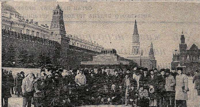
На снимке: участники семинара на Красной площади.