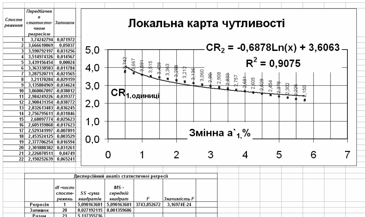
Рис. 1. Локальна карта чутливості: зміна індексу поточної ліквідності при відсотковій зміні кошторисної вартості, будівельного проекту.