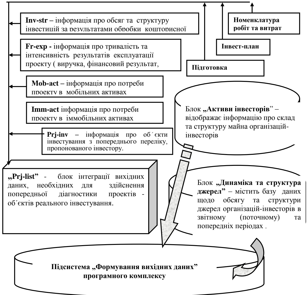
Рис. 3. Призначення та структура підсистеми формування вихідних даних програмного комплексу.