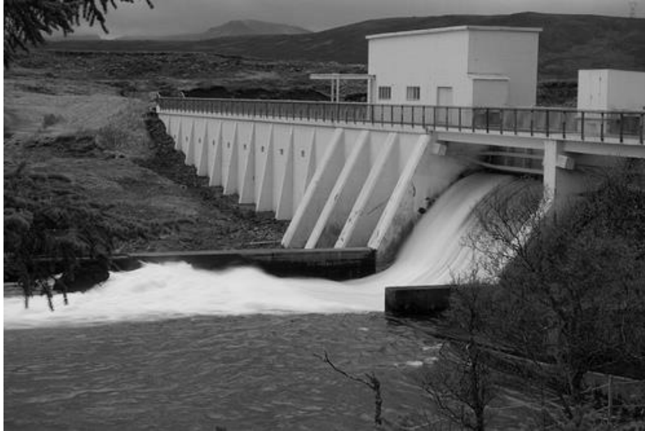
Рис. 2. Общий вид малой ГЭС

Подобные ГЭС можно проектировать на небольших реках, не затопливая при этом полезную территорию.