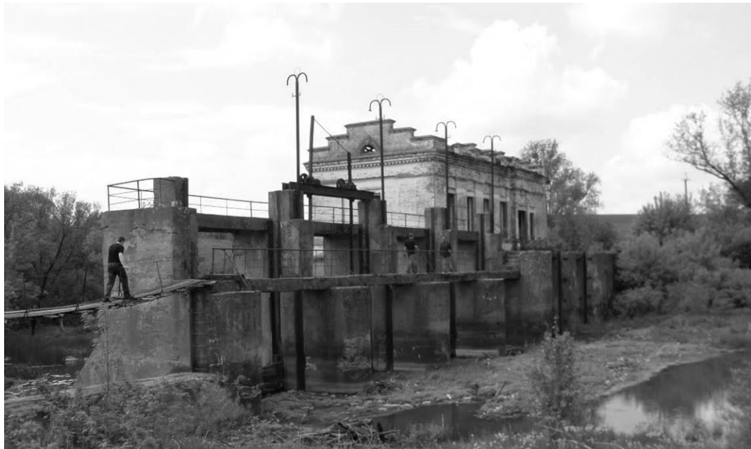
Рис. 6. Массивные конструкции МГЭС в с. Кривые Колена

Многие из земляных плотин заброшенных МГЭС представляют собой опасность аварийного обрушения или прорыва. Как правило, за покинутыми станциям не ведется наблюдения за техническим состоянием основных конструктивных элементов, а также за состоянием плотин, в результате прогрессирующей фильтрации внутри тела земляной плотины происходит постепенный размыв конструкции, который влечет за собой потерю несущей способности и как результат – обрушение и размыв. На рисунке 6 приведен пример МГЭС, находящейся в аварийном состоянии с размывтой земляной частью плотины.