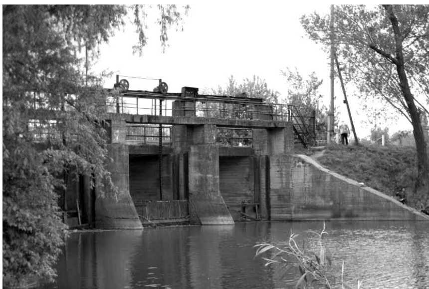
Рис. 5. Массивные конструкции МГЭС в с. Вороное