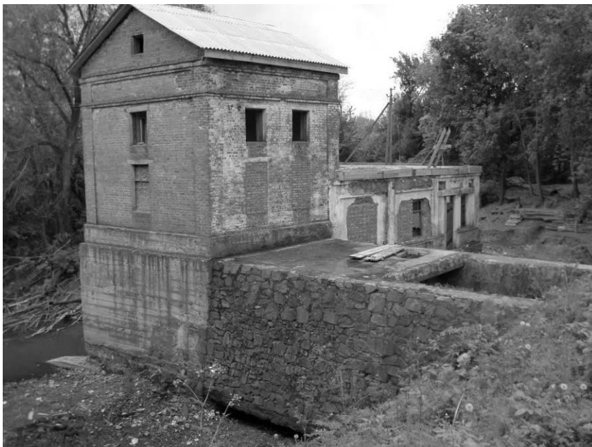
Рис. 4. Здание машинного зала МГЭС в с. Вороное

На рис. 4-5 приведен пример заброшенной МГЭС в с. Вороное.