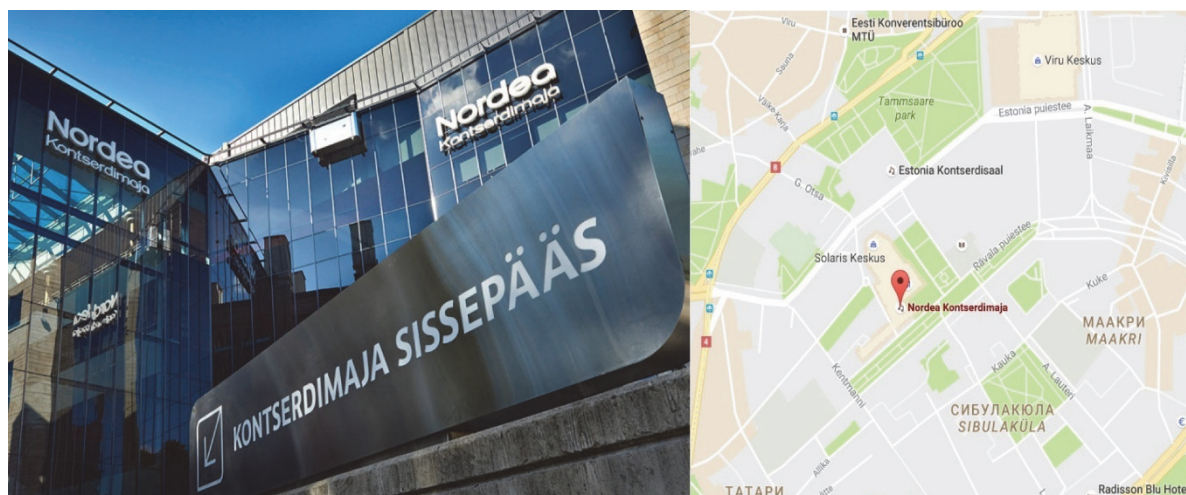
Рис.2 Концертный дом Nordea в Таллине, Эстония

Следует учесть особенности прилегающего к будущему комплексу участка. Здание должно быть доступно и досягаемо (можно легко составить план местности, добраться, доехать общественным транспортом, возможно разместить на стоянке туристские автобусы или личные автомобили). Участок должен позволять решить вопросы реконструкции здания, пристройки дополнительных помещений. Доступность подразумевает также, что службы, задействованные в обеспечении безопасности комплекса, выполняют свои задачи беспрепятственно. При выборе участка или здания обязательно учитываются требования безопасности, предъявляемые к культурно-зрелищным учреждениям (наличие близлежащих зданий, их размещение относительно комплекса, наличие общих переходов). Учитывается и перспектива развития местности (строительство еще каких-либо зданий, коммуникаций, прокладка дорог и т. п., что может повлиять на качество внешней и внутренней среды киноконцертного комплекса, потребовать от него дополнительных затрат на ликвидацию негативных последствий: загазованности воздуха, вибрации, излишнего шума и т. д.).