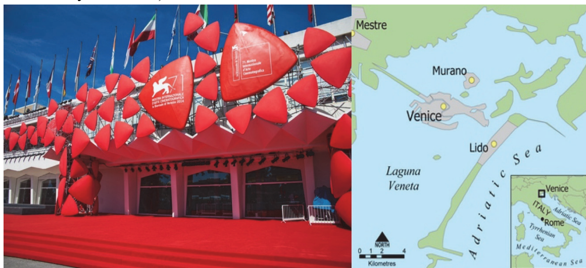
Рис.3 Дворец кино (Palazzo del Cinema) на острове Лидо в Венеции, Италия

Следует учесть особенности прилегающего к будущему комплексу участка. Здание должно быть доступно и досягаемо (можно легко составить план местности, добраться, доехать общественным транспортом, возможно разместить на стоянке туристские автобусы или личные автомобили). Участок должен позволять решить вопросы реконструкции здания, пристройки дополнительных помещений. Доступность подразумевает также, что службы, задействованные в обеспечении безопасности комплекса, выполняют свои задачи беспрепятственно. При выборе участка или здания обязательно учитываются требования безопасности, предъявляемые к культурно-зрелищным учреждениям (наличие близлежащих зданий, их размещение относительно комплекса, наличие общих переходов). Учитывается и перспектива развития местности (строительство еще каких-либо зданий, коммуникаций, прокладка дорог и т. п., что может повлиять на качество внешней и внутренней среды киноконцертного комплекса, потребовать от него дополнительных затрат на ликвидацию негативных последствий: загазованности воздуха, вибрации, излишнего шума и т. д.).