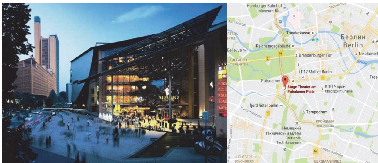
Рис.1 Дворец Berlinale Palast в центре города Берлин, Германия.

Не смотря на некоторые плюсы расположения киноконцертных комплексов за городом, для проектирования объекта все же выгоднее будет расположение в центре, так как он рассчитан на ежедневное посещение людей.