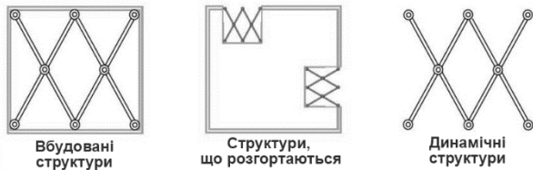
Рисунок 1. Типи кінетичних структур [2]

розташованих по периметру форми та зазвичай на однаковій відстані від центру.