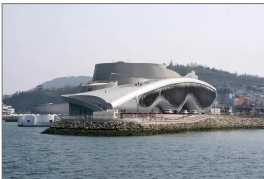
Рисунок 2. Павільйон One Ocean Pavilion of Soma, Сос, Південна Корея. [5]

У сучасному проектуванні громадських будівель кінетична архітектура все більше знаходить застосування, оскільки дозволяє значно підвищити функціональність, ефективність та візуальну привабливість будівель. На прикладі будівлі One Ocean Pavilion of Soma в Сосу, Південна Корея, фасад якої складається з 108 індивідуально керованих плавників, які рухаються подібно до зябер риби (рис.2). Та двічі на день фасад рухається, як гігантська хвиля, що пробігає всю будівлю. Крім того, ці плавники регулюють світло і мікроклімат всередині приміщення [5]. Тобто можна зазначити, що цей приклад ілюструє тенденцію щодо можливої реакції будівлі на зовнішні чинники задля створення сприятливих умов всередині. Цей процес відбувається через використання рухомих фасадів, або структурних оболонок, які не лише створюють вражаючі візуальні ефекти, а й виконують функціональні завдання, такі як регулювання освітлення та клімату в приміщенні.