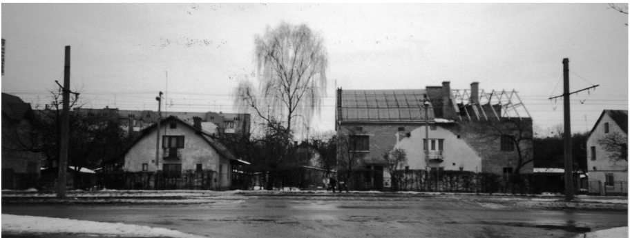
Рис. 2 Трансформація малоповерхової забудови 1950-их років на вул. Княгині Ольги у Львові станом на 2004 рік. Ліворуч одноповерховий будинок з мансардою, який поки що зберіг первісний вигляд; праворуч – такого ж типу будинок тільки з добудовою і надбудовою, контури старого фасаду ще проглядаються

Львів перетворюється у крупний промисловий і культурний центр Радянської України. Для здійснення реконструкції та благоустрою міста за генеральним планом, розробленим Діпромїстом і затвердженим постановою Ради Міністрів УРСР в 1956 році, розподіляється на зони : багатоповерхову (чотири – п'ять) поверхів, малоповерхову (два – три поверхи і одноповерхову, розраховану в основному на індивідуальне будівництво. У 1957 році у Львові розгорнулося масове спорудження одноповерхових з мансардою і двоповерхових будинків. Ділянки цього будівництва відведено в зонах малоповерхової забудови в основному великими масивами недалеко від промислових підприємств.