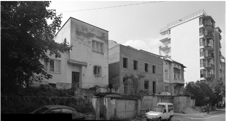
Рис. 3 Архітектурно-просторові трансформації історично сформованої віллової забудови на вул. Погулянка. Багатоповерхова забудова та добудова історичних вілл за рахунок прибудинкових садів назавжди порвали простір колись романтичної Погулянки. Чи встоїть перед наступом багатоповерхівок те що залишилось від простору Погулянки? – питання найближчого часу.

Певна кількість двоповерхових будинків – кожен окремо або групами – по два–три і навіть чотири – з’явилися на вільних ділянках у різних районах міста. Нове житлове будівництво з високим рівнем інженерного обладнання сприяє поліпшенню благоустрою робітничих околиць. Так, наприклад, завдяки розміщенню крупних масивів нового будівництва на околицях міста – Левандівка перетворюється в благоустроєне селище. На відміну від довоєнного періоду забудова проводиться за типовими проектами будинків, розробленими Львівською філією Діпромста.