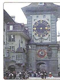
Дзвіниця Цитлоглетурм з курантами