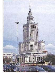
Варшавський Годинник Тисячоліття