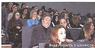
Всі слухають з цікавістю

З 28 листопада по 2 грудня архітектурний факультет КНУБА приймав міжнародний семінар, присвячений оперативному підходу до територіального маркетингу, сталому розвитку туризму і культурних заходів для просування архітектурної та міської спадщини періоду Авангард.