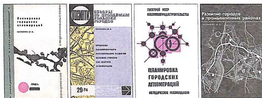
Основні наукові публікації І.О.Фоміна (1960–80 рр.)