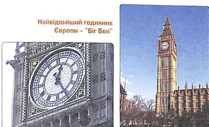
Найвідоміший годинник Європи – "Біг Бен"