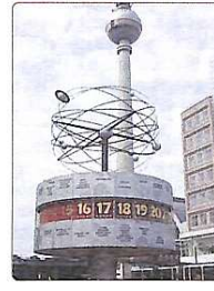
Годинник "Світовий час"