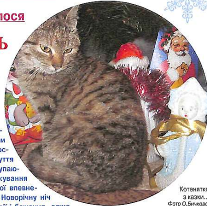
Котенятко з казки...

Новий рік. Що пригадується нам, коли ми чуємо це словосполучення? Відчуття неодмінного наступного щастя, очікування подарунків і повної впевненості, що саме в Новоріччю ніч здійсниться всі мрії і бажання, адже Новий рік – це єдине свято в році, коли можливо чаклунство. Перед кожним Новим Роком хочеш не хочеш, а приходиться на пам'ять рік, що пішов. Читайте-те, що пригадалось дружокурисниці Оксані Бичковій.