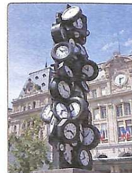
Скульптура "Час для всіх"