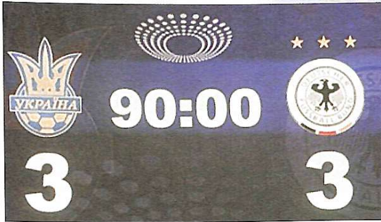
11 листопада на стадіоні НСК "Олімпійський" відбувся матч Україна – Німеччина. Чи відбулися зміни щодо організації проведення спортивного заходу на стадіоні після деяких недоліків під час відкриття 8 жовтня?

Я побачила це разом 44-ма чоловіками, представниками нашого університету – ми допомагали у тестуванні стадіону, й відвідування матчу слугувало нам винагородою. Вболівальники було чимало – 69720 чоловік. До їх послуг були встановлені намети з логотипами відомої пивної компанії "Чернігівське". За власним бажанням вони могли для підтримки наших футболістів дозволити помістити яскраве зображення символіки держави або емблеми команди України у себе на обличчя та отримати утеплення на стільці. У кожного присутнього на бильцях стільців були поміщені надруковані подушечки синього або жовтого кольору, які служили предметом вболівання. За межами ж стадіону люди не втрачали нагоди продати шарфи, свистки тощо благодію – жовтого забарвлення з емблемою нашої команди. Але на території стадіону всім відвідувачам було запропоновано придбати цію ж символіку за значно дорожчою ціною.