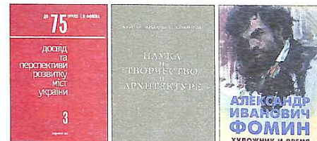
Основні наукові публікації І.О.Фоміна початку XXI ст.

Ігору перу належать 200 друкованих праць, серед них 8 монографій і навчальних посібників, зокрема: "Основи теорії містобудування" (1997), "Развитие городов в промышленных районах. Планировочные аспекты" (1974), "Город в системе населенных мест" (1986), "Основи районної планировки" (з