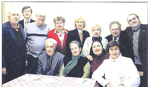
Клуб шанувальників поезії "Стих і Я"