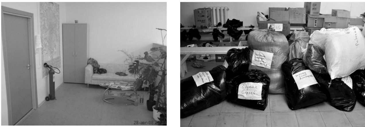
Рис. 5. Приклад офісу соціального спрямування, що потребує змін

Негативним прикладом дизайн-вирішення в проектуванні простору окремих благодійної організації можуть слугувати офіс «Україна третього тисячоліття», який функціонує на даний момент на території нашої держави (рис. 5).