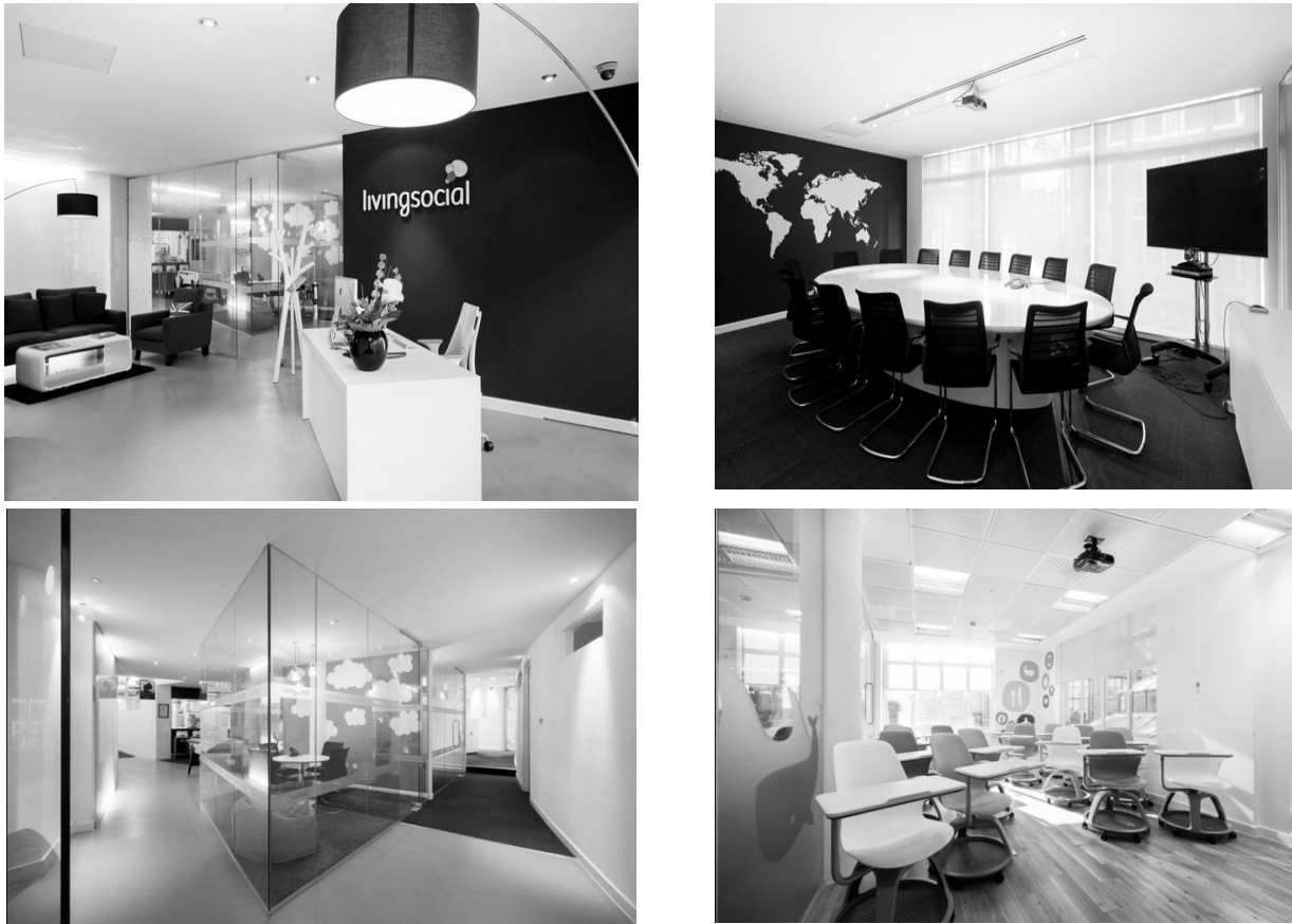
Рис.4 Офіс LivingSocial, Лондон

Негативним прикладом дизайн-вирішення в проектуванні простору окремих благодійної організації можуть слугувати офіс «Україна третього тисячоліття», який функціонує на даний момент на території нашої держави (рис. 5).