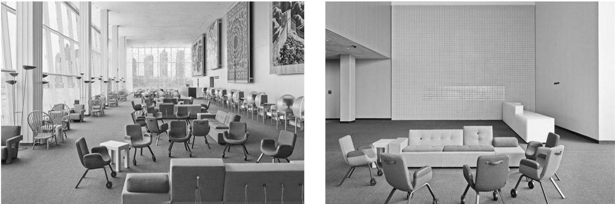
Рис.2 Лаундж-зона в офісі ООН, Нью-Йорк, 2013

Дизайнери Хелле Йонгеріус та Рему Коолхаасу виконали редизайн лаундж-зони офісу ООН в Нью-Йорку (рис.2).