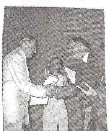
Кращий підручник написав І. І. Назаренко