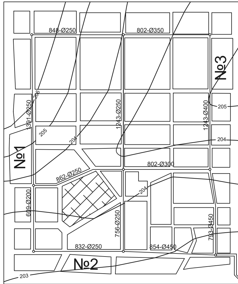
Схема магістральної водопровідної мережі (М1:10000)