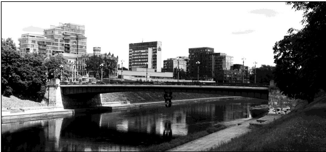
Рис. 2. Зелений міст у Вільнюсі, 1948 – 1952 рр. Загальний вигляд

Сучасний міст був зведений у 1948–1952 рр. за проектом ленінградського інституту «Проектстальконструкція» (головний інженер Є. Попов) силами радянських воєнно-інженерних військ Прибалтійського військового округу. Тоді міст був названий у честь генерала І. Черняховського (рис. 2). З інженерного аспекту міст однопролітний з криволінійними обрисами нижнього поясу. Довжина мосту – 102,9 м, ширина – 24 м, висота над рівнем води – 15 м.