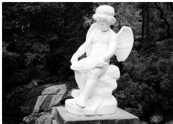
Рис. 3. Скульптура Купідона [4].

Його краса і живописні краєвиди надихають художників, поетів і фотографів, роблячи його джерелом натхнення для творчості. Парк оточений багатьма легендами і тасмніцями, зокрема про тасмні проходи закоханих, які шукали укриття серед його алеї [5].