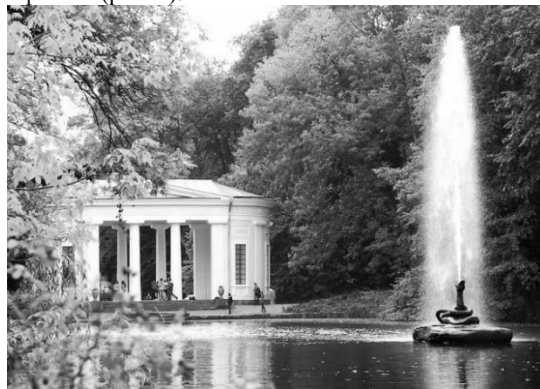
Рис. 2. Фонтан «Змія» [4].

дозволило втілити концепцію водної стихії в ландшафті. Проект був реалізований протягом приблизно шести років. Неабияку роль у створенні парку відіграв німецький садівник – Олива [2]. Проте, парк продовжує розвиватись і зараз, додаються нові елементи і проводяться роботи по благоустрою території. У 2019 році було відкрито новий об'єкт, поруч з парком «Софіївка», який має назву «Нова Софіївка» (рис. 2).