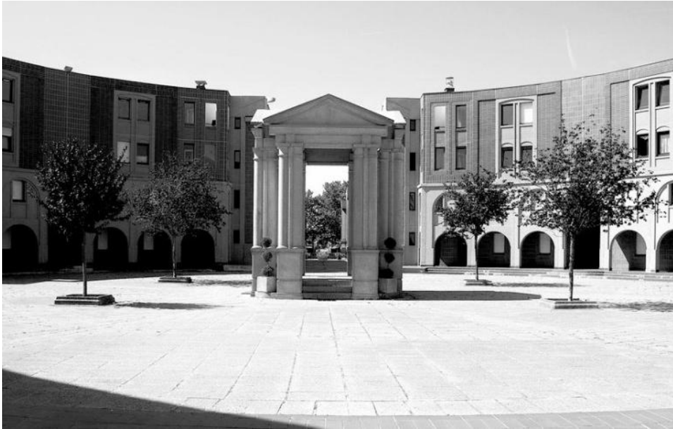
Рис. 5. Житловий комплекс "Лез-Аркад-дю-Лак", пригород Парижа Сен-Кантен-ан-Івлін, арх. Р. Бофіл 1972-1975 рр.