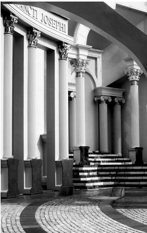
Рис. 3. Фонтан на П'яцца д'Італія, Новий Орлеан, арх. Ч. Мур, 1977 р.