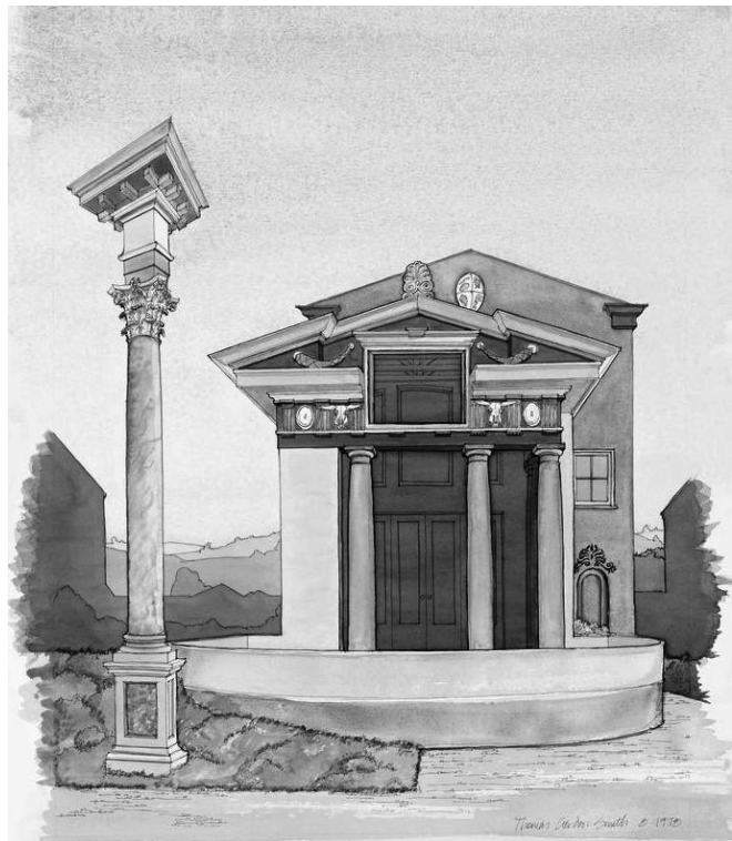
Рис. 4. Проект будинку на Метьюз-стріт, Сан-Франциско, арх. Т. Гордон Сміт, 1978 р.