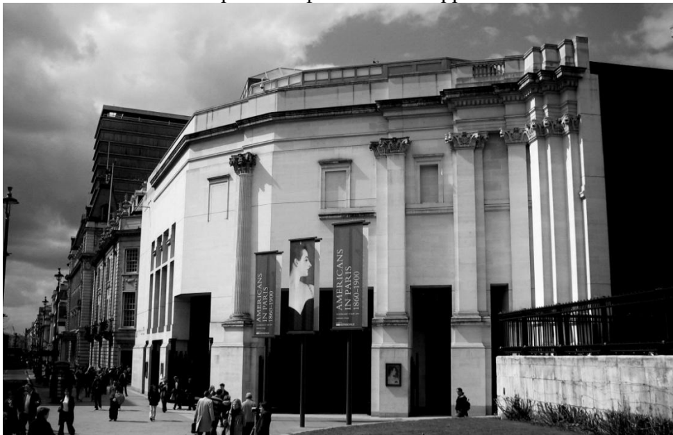
Рис. 6. Західне крило Національної галереї на Трафальгар-сквер, Лондон, арх. Р.Вентурі і Д.Скот-Браун 1986-1991 рр.

Висновки. Використання античних ордерів має багатовікову історію. Своєю довговічністю антична грецька ордерна система завдячує немаловажливим фактом відкритості ордера в поєднанні з іншими тектонічними системами, а також величезним потенціалом до різноманітних модифікацій і трансформацій, що дозволило створювати в різні часи яскраві, стійкі архітектурні напрями і стилі. Постмодернізм – одна з ланок в ланцюгу таких відроджень. Архітекторами цього напрямку була зроблена вдала спроба інспірації архітектурного ордера в культурний пласт минаючого двадцятого століття.