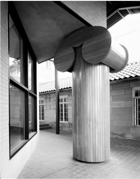
Рис. 1. Колонна художнього музею в Оберліні, США, арх. Р.Вентурі

силою, остаточно зруйнувало віру в те, що нове завжди краще. Багато західноєвропейських архітекторів відповіли на імпульс постмодерністської культури зверненням до традиційних цінностей, пов'язаних із сформованими контекстами середовища.