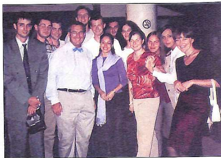
Професор Кристоф Бреділле із студентами

Для себе, окрім цікавих ідей і наробок, представивши колегами, я ще зробив висновок, що конференції такого рівня і масштабу необхідно організувати в Україні. В сучасних умовах стрімкого ривку інформаційних технологій, і ідентифікації темів розвитку всіх галузей, інтернаціоналізації ринків, всебічної орієнтації інституту управління на проектну основу, важливим стає підвищення якості і інтенсивності обміну інформацією між спеціалістами в га-