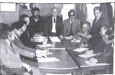
Засідання кафедри ПЦБ в Кабулі