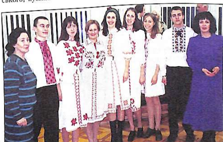
Під час зустрічі