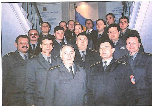
Колектив викладачів військової кафедри

ДОРОГІ НАШІ ЧОЛОВІКИ, ЛИЦАРІ ДОБЛЕСТІ І ЧЕСТІ! ПРИЙМІТЬ СЕРДЕЧНІ ВІТАННЯ З НАГОДИ ДНЯ ЗАХИСНИКА ВІТЧИЗНИ! ДОБРА, ШАСТЯ, БЛАГОПОЛУЧЧЯ ВАМ І ВАШИМ РОДИНАМ