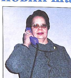
Заст. декана з питань перепідготовки спеціалістів