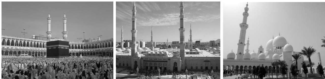
Рис. 4. Мечеть аль-Харам (Masjid-al-haram) в Мекке, Саудовская Аравия. Рис. 5. Masjid Nabawi. Медина, Саудовская Аравия. Рис. 6. Большая мечеть в Абу-Даби, ОАЭ.

углы закреплены башнями со спиралеобразными завершениями подобно минарету в Самаре в Ираке. Конической формы минарет завершен маленьким куполом. Основной молельный зал перекрыт 44 куполами, двор окружен ж/б аркадой стилизованной стрельчатой формы. Перечисленные особенности стали знаковыми для мечетей Катара. Судьба этой мечети плачевна. Она вновь была снесена в 2009 г. Однако на другом значительно большем участке в Доха вновь строится государственная мечеть, в увеличенном виде повторяющая черты мечети Аль-Кубиб (рис. 3). Таким своеобразным путем традиция продолжается.