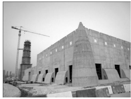
Рис. 1. Abu Manaratain Mosque in Al-Wakra, Qatar, 1940 г. Рис. 2. Al-Qubib Mosque в Доха, Катар (снесена в 2008 г.). Рис. 3. Государственная мечеть в Доха, Катар.

Особенно примечательна мечеть Ал-Кубиб в г. Доха (рис.2). Она была построена в 1998 г. по образцу мечети, разрушенной в 1950-х годах, но уже из бетона и железобетонных блоков и является уникальным примером многокупольной мечети. Ее внешние формы нарочито подчеркивают рукотворность старого прототипа своей шероховатой поверхностью стены,