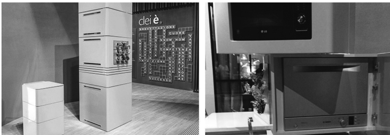
Рис. 2 Інтерактивний кухонний модуль-трансформер «Ecooking», італ. фабрика «Clei», 2008р.

площину (рис. 2). Кожен сегмент даного кухонного модулю при необхідності може змінювати свою конфігурацію: висуватися, обертаючись навколо своєї осі. Мийка, варильна поверхня, потужні повітроочисні системи, обробна дошка, стіл для сніданків і вертикальний «міні-сад» – компактний модуль, легким рухом руки перетворюється на повноцінний кухонний центр композиції.