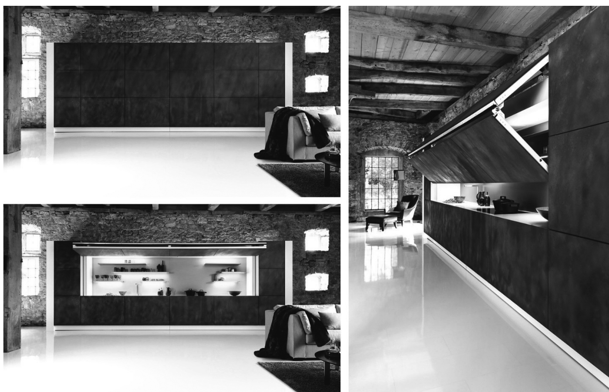
Рис. 5 «Прихована» кухонна зона від дизайнера Ф. Старка та «Warendorf» «Living Kitchen 2013»

У бічних пеналах з дверцями розміщена різна побутова техніка, в тому числі духові шафи, посудомийна машина і холодильник. Нижні шафи висувуються також вперед. Дана «прихована» кухня підійде для багатофункціонального приміщення в промисловому стилі для квартир-студій або у суміщених кухонь-вітальень.