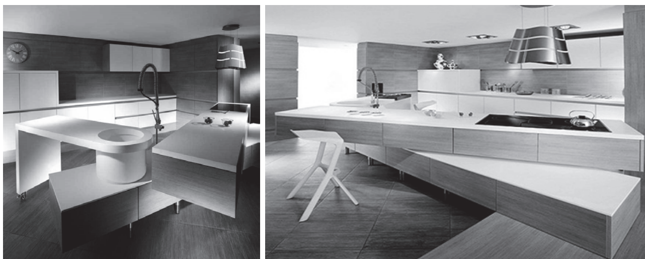
Рис. 3 Інноваційна «острівна» кухня, від «Amr Helmy Designs», 2015р

Інноваційна ідея в організації «острівних» кухонь запропонована єгипетською фірмою «Amr Helmy Designs». Було розроблено так званий острів-трансформер (рис. 3). Крім традиційної мийки і варильної поверхні він складається з декількох елементів, що обертаються. Дані обертання дозволяють змінювати конфігурацію «остова-острова», створюючи ідеальні умови для найбільш ефективного використання кухонного простору.