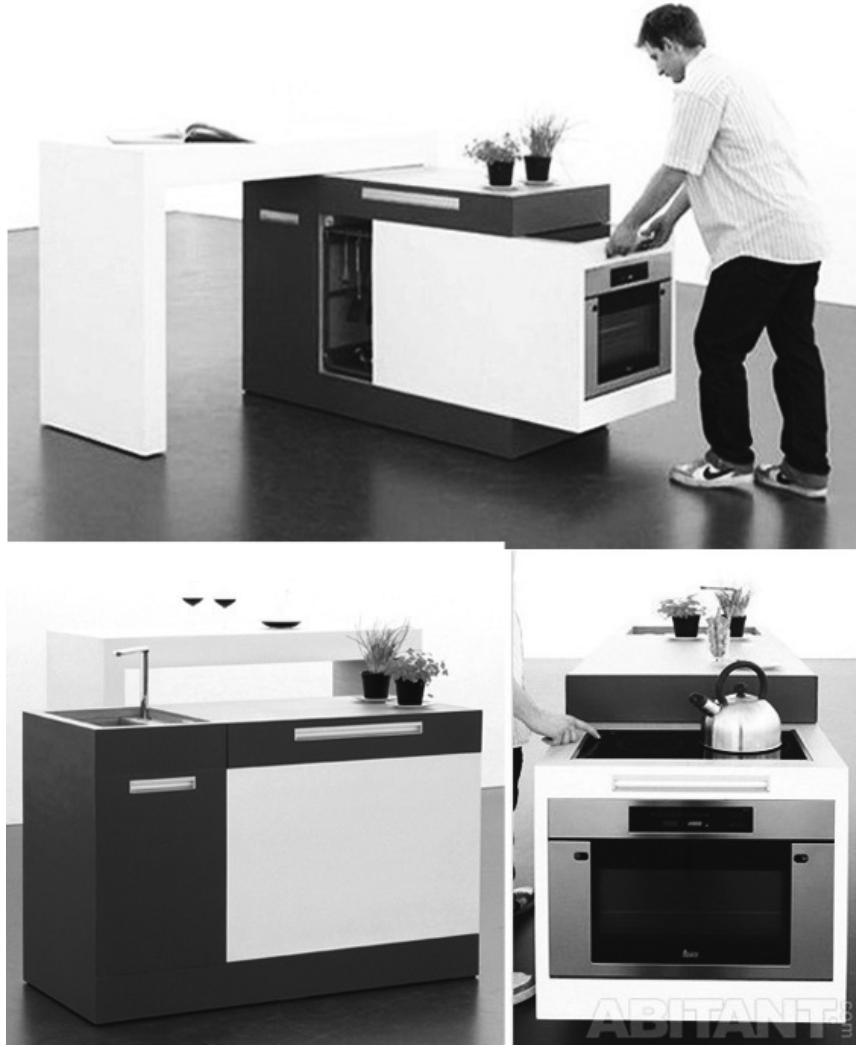
Рис. 4 «Острівна» міні-кухня, дизайнери К. Лаасс і Н. Ельберт, 2011р.

можна знайти електричну плиту та духову шафу, вмонтовані шафи для зберігання кухонних приладів, мийку, а також міні-холодильник. При бажанні кухню можна трансформувати в обідній стіл, за який можуть сісти 2-4 особи.