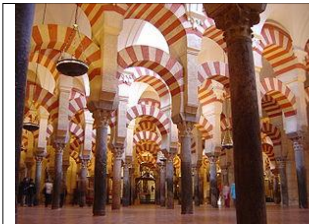
Рис. 8. Зал ста колон

Розкіш мусульманського храму визначила, що максура і міхраб залишилися недоторканими. Цей новий собор каплиця в старій мечеті буде залежати від єпископа Ініго Манрике (1486-1496), який просуває будівництво нав з готичним архітектурним дизайном і деякими модифікаціями. Проте, найбільше занепад ісламської будівлі відбуватиметься протягом шістнадцятого століття, в середині старої мечеті нава християнського собору зводиться під егідою художнього та архітектурного ренесансу, що стало серйозним порушенням ісламських просторових постулатів.