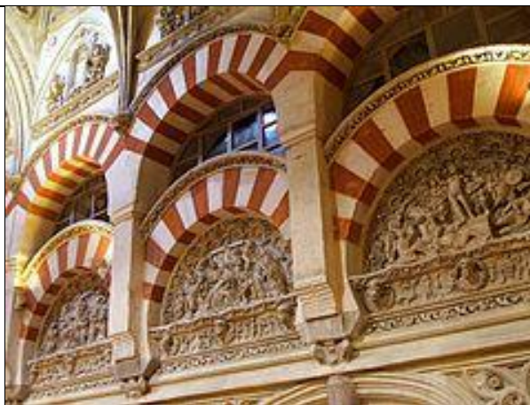
Рис. 9. Каплиця св. Івана Хрестителя