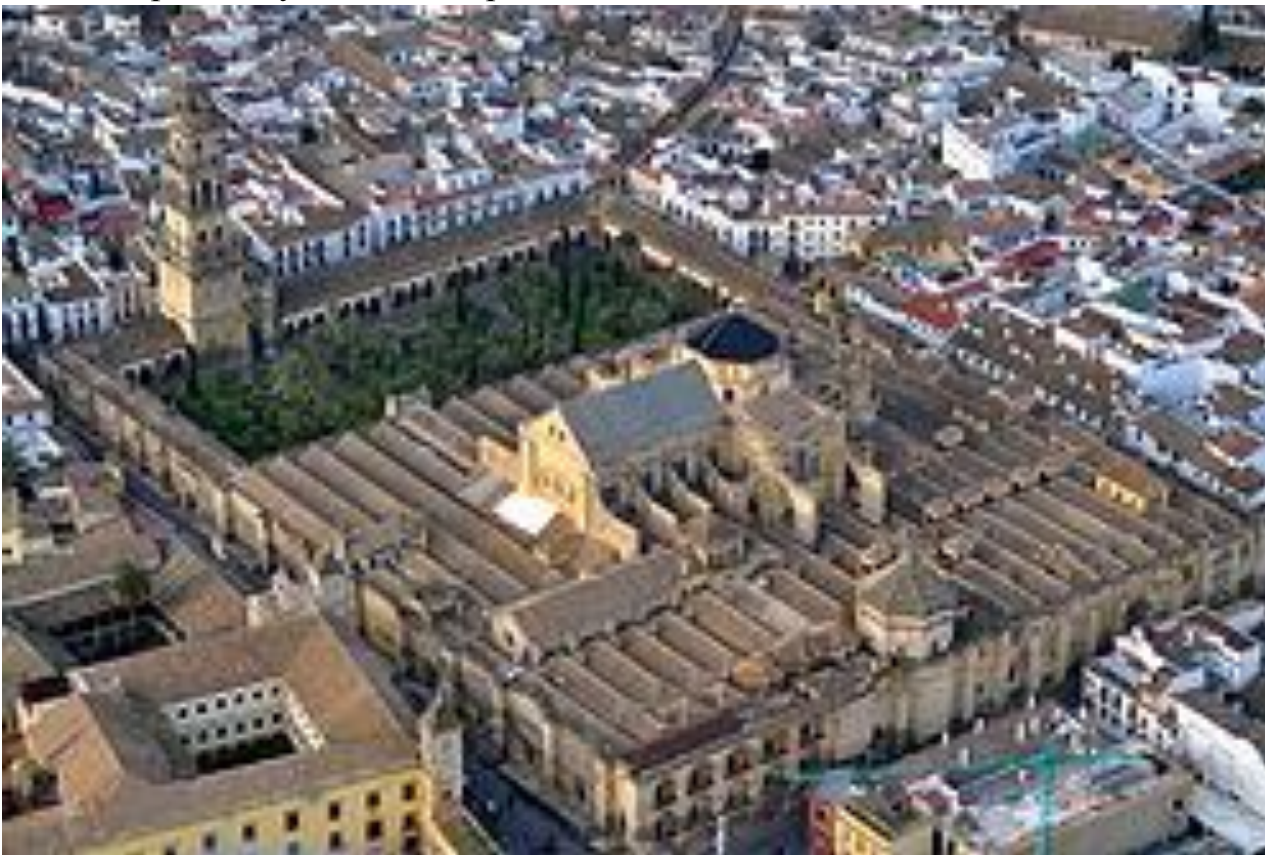
Рис. 1. Вид з пташиного лету на Кордовську мечеть-собор

Основна частина. Еволюція побудови Мескіти починається від її християнського походження базиліка Сан-Вісенте Мартрі, будівництво якої почалося приблизно в 600 р. і зводилась вона як вестготських церква Вікентія Сарагоського (базиліка Сан-Вісенте Мартрі). Після приходу ісламу на півострові одна частина була присвячена ісламському поклонінню і ще залишалось християнське віросповідання. Це співіснування було складним, і зобов'язання не завжди дотримувались. Так, під час конфлікту в 748 р., мусульманська влада використовували християнську частину для розгляду і винесення вироку до смерті ватажків єменців. Пізніше стала мечеттю - спочатку «Мечеть Аль-Джама», первісна будівля не збереглася до наших днів.