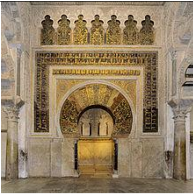
Рис. 6. Міхраб