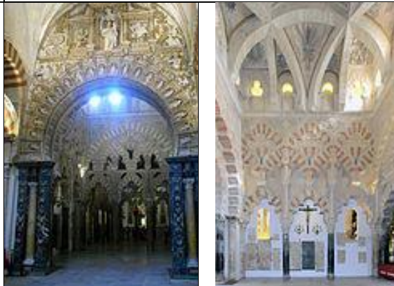
Рис. 10. Каплиця Вільявісйоза

Незважаючи на примхи історії, давньої ісламської мечеті зберігається у своїй суті, з унікальністю основ. З цієї точки зору, мечеть-собор являє собою синтез злетів і падінь історії Іспанії - це архітектурний гібрид, який синтезує багато художніх цінностей Сходу і Заходу.