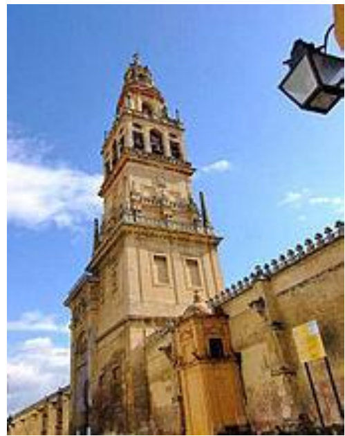
Рис. 7. Дзвіниця, яка оточує мінарет.

В інтер'єрі мечеті застосовані подвійні аркади (напівциркульні і зубчасті) на круглих стовпах-колонах, які оформлені чергуються камінням темних і світлих тонів. Ця складна багатоколонна споруда (рис.8) спочатку було в кілька разів менше, мечеть розбудовувалась до XV ст., після чого з'явилося ще три невеликих внутрішніх дворика для молитов. Перше будівництво складається з одинадцяти поздовжніх бухт, що стоять перед річкою Гвадалквивіру, ширина яких однакова, за винятком центрального, що веде до міхраба, основи якого були знайдені в підвалі каплиці Вільявісйоза (рис.10) був задуманий монументально з вхідною аркою підтримується чотири колон і виступає за межами стіни Кіблі. Центральний трохи ширший, ніж інші, і злегка вужчі сторони, хоча ці невеликі відмінності лише помітні в одній площині. Ці нави складаються з дванадцяти колонних галерей, які йдуть до стіни ківби. Для поліпшення освітлення влаштовано чотири світлові люки з реберними куполами. Перший, перед Максурою, в даний час займає Каплиця Вільявісйоза. Інші три піднімаються перед новою стіною кіблі; один перед міхрабом, а два інших - флангують його.