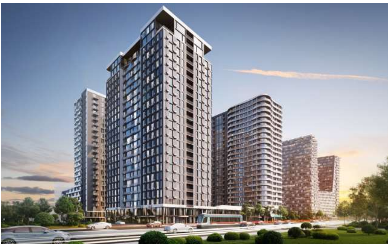
Рис. 2.2 Перспектива

[ https://creatorcity.com.ua/ua/gallery/rendering/6653/6655/ ]