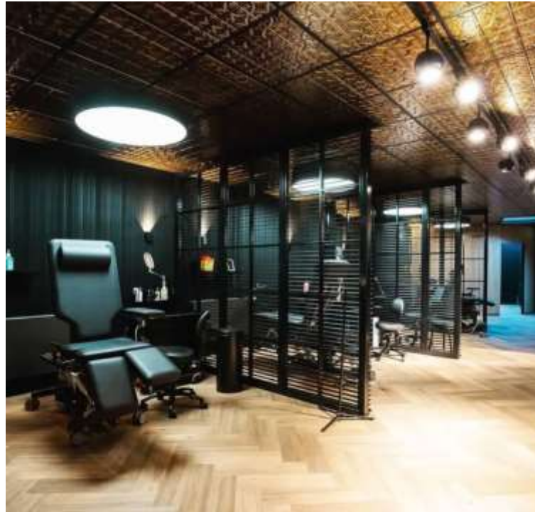
Рис. 1.7 Інтер'єр дизайн-студії NEW YORK CEILING CO. Верт, Нідерланди

Отже, цей дизайн проект можна назвати комфортним, естетичним, атмосферним, унікальним і при цьому ідеально потрапляючим під цільову аудиторію салону.