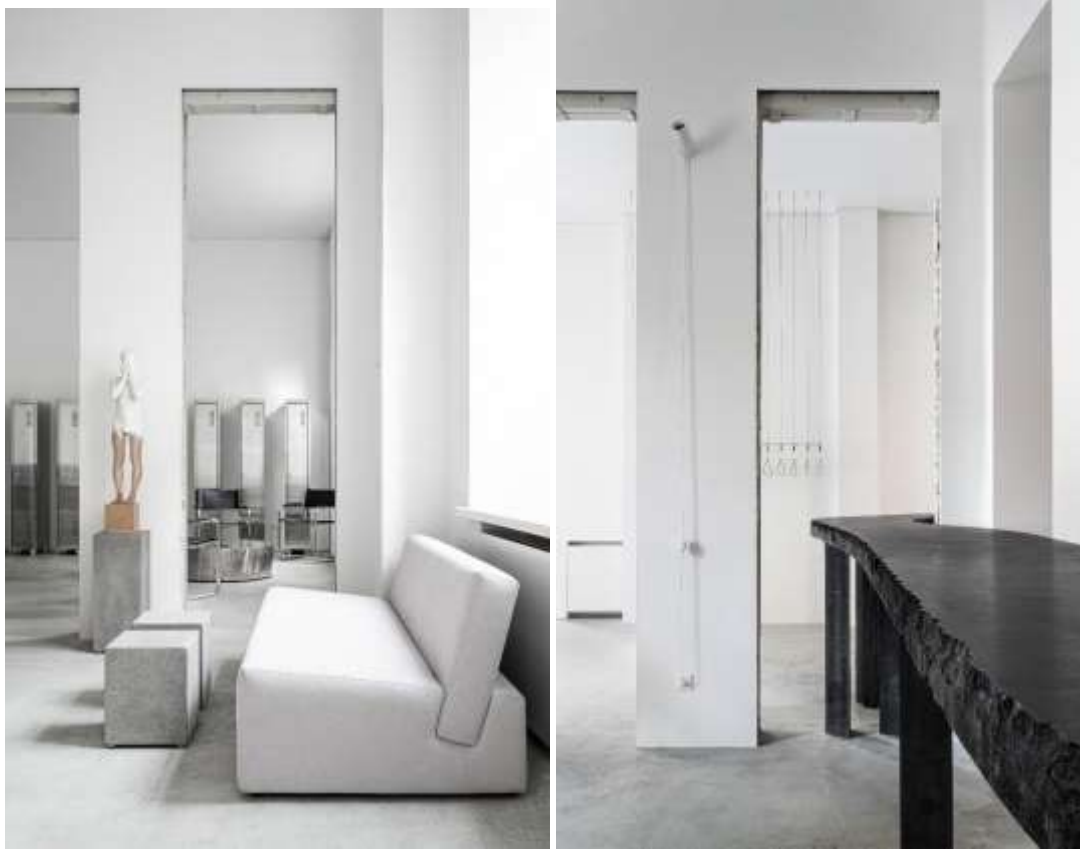
Рис. 1.1, 1.2 та 1.3 Інтер'єр дизайн-студії balbek bureau. Київ, Україна