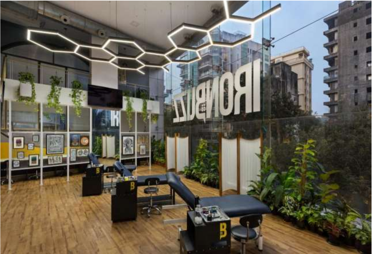
Рис. 1.8 Інтер'єр дизайн-студії Studio 6158. Бандра, Індія

[ https://www.architectandinteriorsindia.com/projects/18684-aiexclusive-a-tattoo-studio-thats-setting-new-standards-with-its-green-approach ]