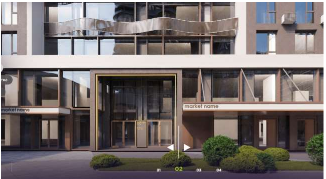
Рис. 2.3 Вхід та супермаркет у першому будинку