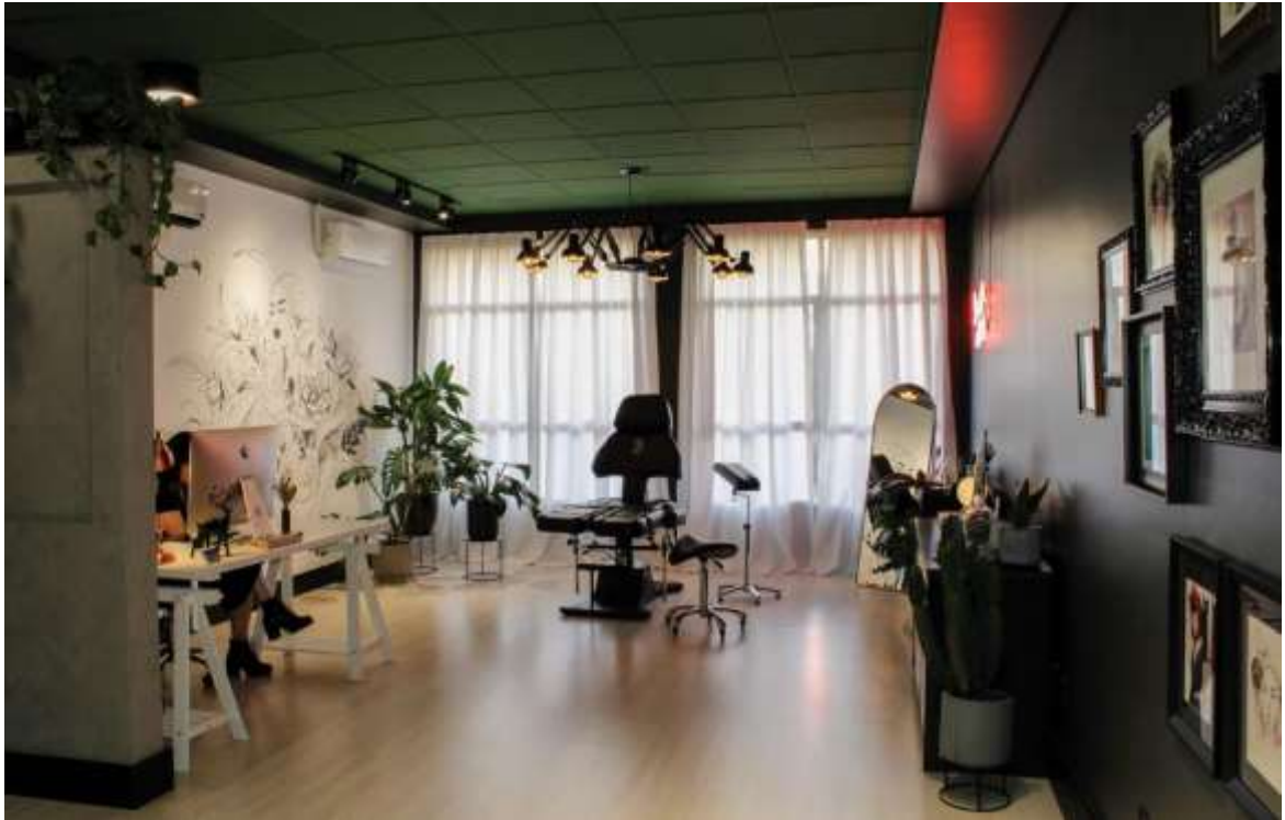
Рис. 1.8 Інтер'єр дизайн-студії CONFES-SIONARIO. Кампінас, Бразилія

працювати багато співробітників, і при цьому кожному потрібний свій окремий простір. Таке рішення для студії тату є хорошим, враховуючи даний тип приміщення.