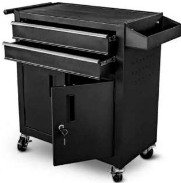
Рис.3.1. Робоча станція Tattoo Workstation Stock

[ https://maketattoo.com.ua/product/0000216308-robocha-stantsiya-tattoo-workstation-stock/ ]