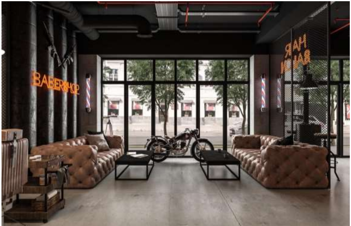
Рис. 1.4, 1.5 та 1.6 Інтер'єр дизайн-студії BORISSTUDIO. Київ, Україна

[ https://borisstudio.com/uzhgorod/dizajn-tatu-salona/ ]