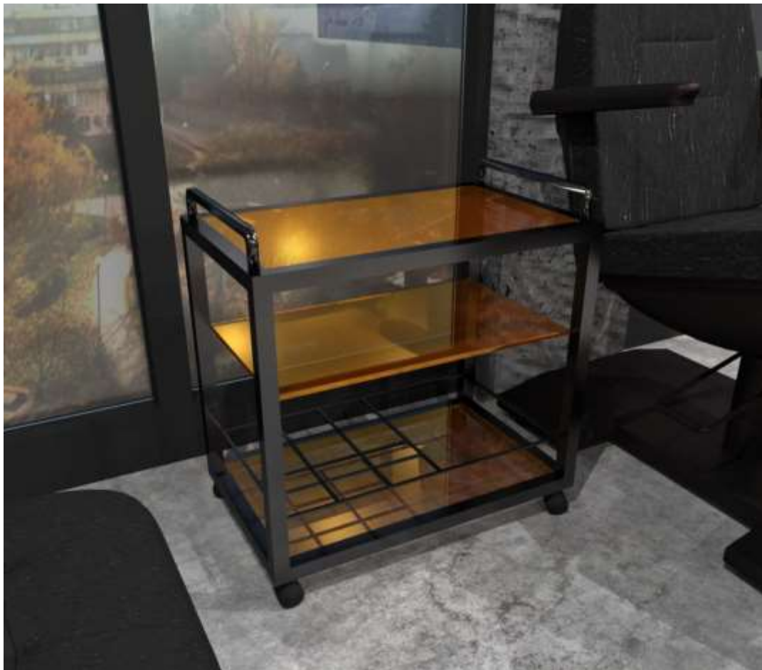
Рис.3.3. 3-Д зображення тату станції

Простота форм та лаконічність. Занадто багатофункціональна або потужна тату станція була б зайвим елементом робочого середовища даного дизайну проекту. Так як в робочому просторі розташовано достатньо полиць із загальними витратними матеріалами і в швидкому доступі - немає потреби перевантажувати станцію. Вона має бути функціональною але простою, комфортною та стильною.