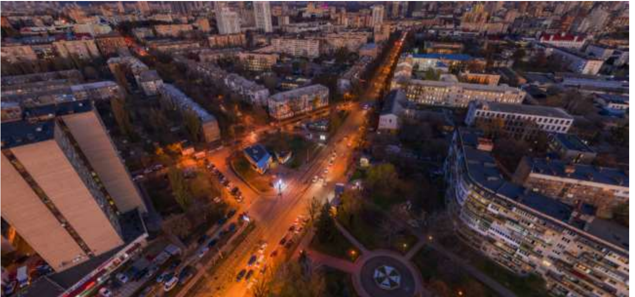
Рис. 2.5 Вид на місто з 25го поверху першого будинку

[ https://creatorcity.com.ua/ua/gallery/rendering/ ]