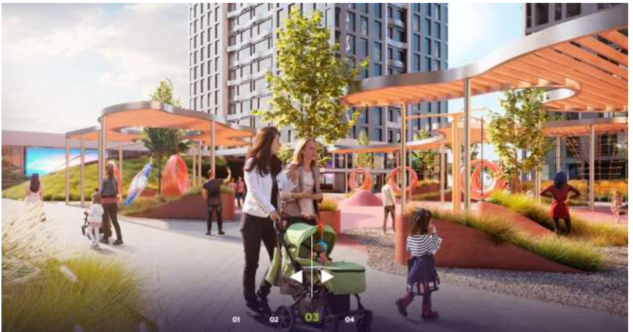
Рис. 2.4 Дитячий майданчик на території першого будинку

[ https://creatorcity.com.ua/ua/gallery/rendering/ ]