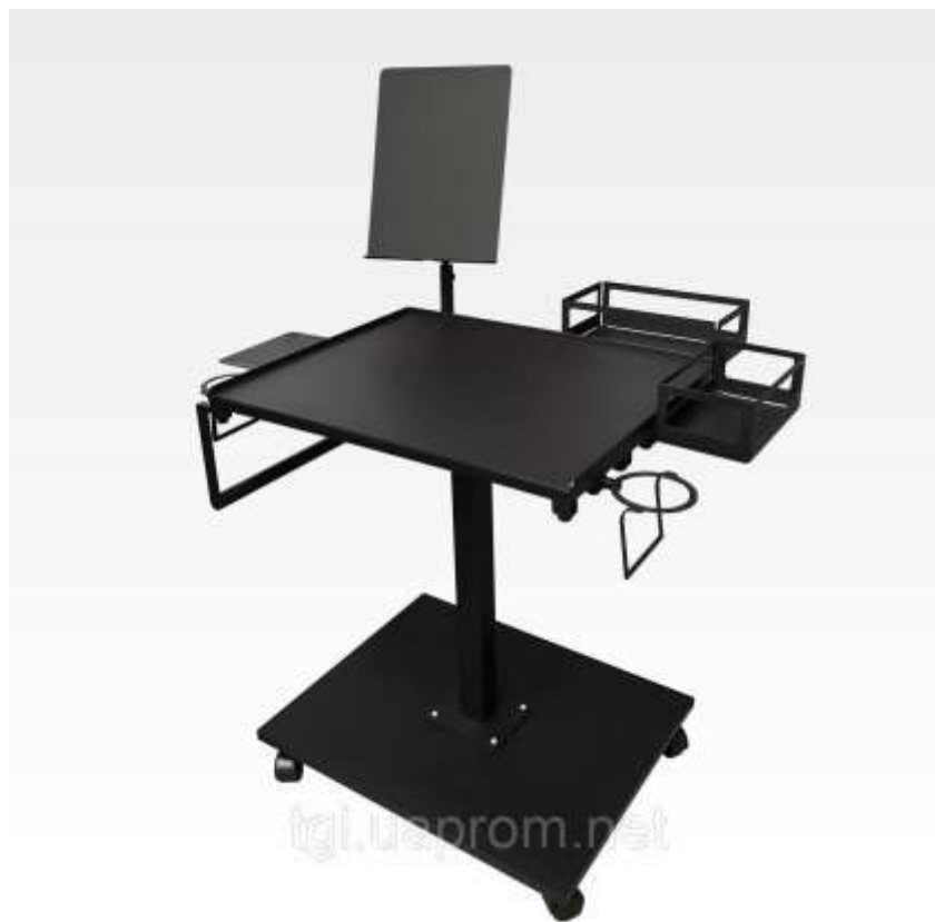
Рис.3.2 Тату станція TGI Workshop

ж, які хочуть зберігати абсолютно весь свій інвентар відразу в одному місці. Для тату студії такий столик не є необхідним, тому що студійним майстрам не потрібно зберігати все і відразу в одному місці, враховуючи, що це робочий стіл.