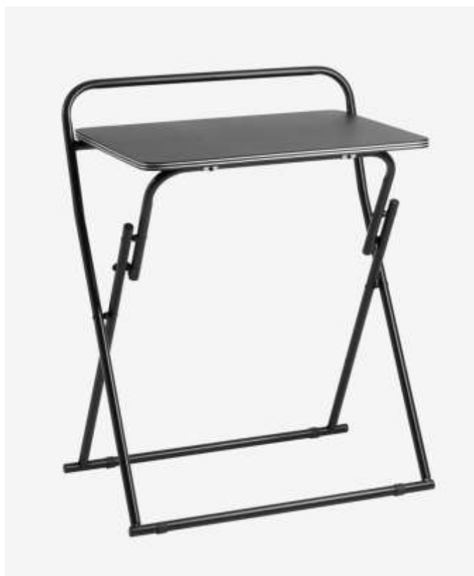
Рис.3.3. Письмовий стіл ІКАСТ

[ https://jysk.ua/ofis/stil-kompyuterniy/stil-pysmovyy-ikast-42x60sm-chornyy ]