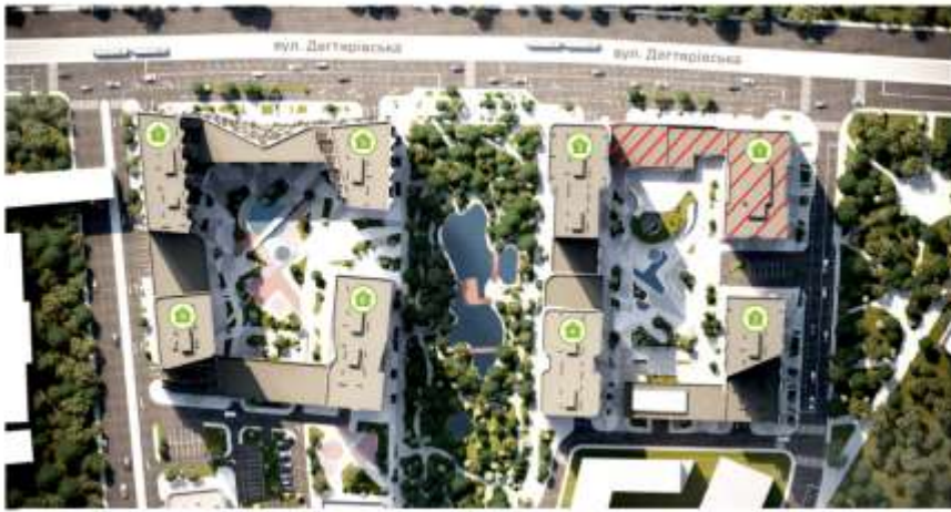
Генплан ЖК Creator City