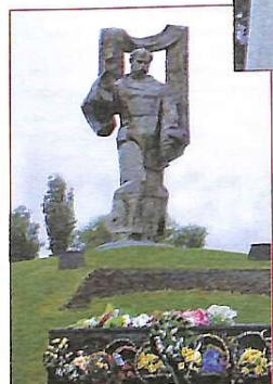
Найвищий у світі пам'ятник Шевченку в Ковелі