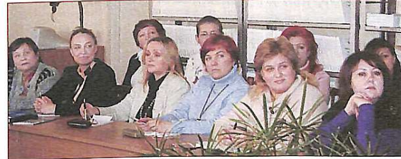
Під час наради