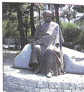
Копенгаген. 1101-й пам'ятник Тарасу. 2010 рік