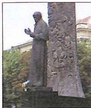
Пам'ятник Кобзарю у Львові