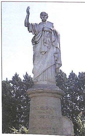
Пам'ятник Кобзарю в Римі