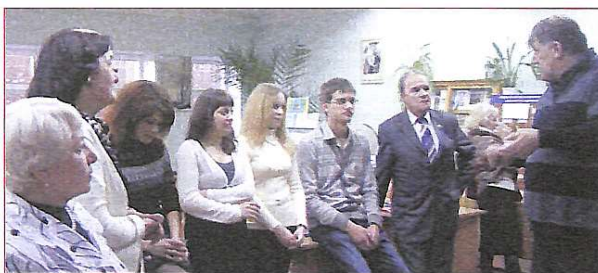
Давайте зустрічатись частіше!