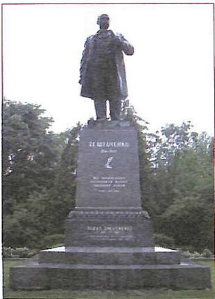
У Торонто (Канада) цей пам'ятник Шевченку було викрадено