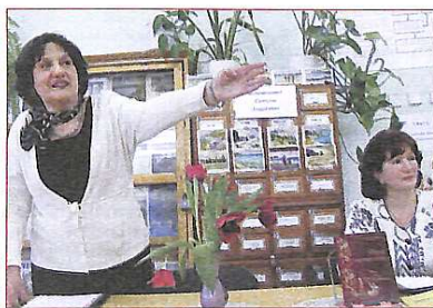
І, справді, вечір удався!