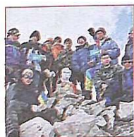
Альпіністи встановили бюст поета на Суганському хребті. 1939 р.