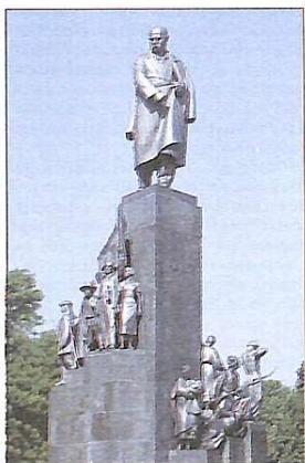
Перший в Україні пам'ятник народному генію в Харкові

Великому поету і художнику Тарасу Шевченку в Україні та світі встановлено понад 1100 пам'яток. Пам'ятники Шевченка є в 47 країнах світу, майже на всіх континентах, крім Африки. Однак у наступному році повинні побувати монумент і в ПАР. Нема пам'яток Кобзарю в Німеччині, Великобританії, Естонії, Латвії, Киргизії.