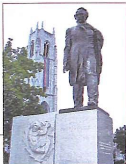
45 років тому у Вашингтоні відкрили пам'ятник Шевченку