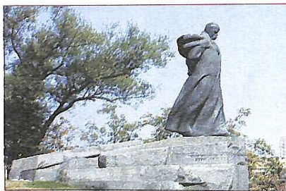
Монумент Шевченку в Москві