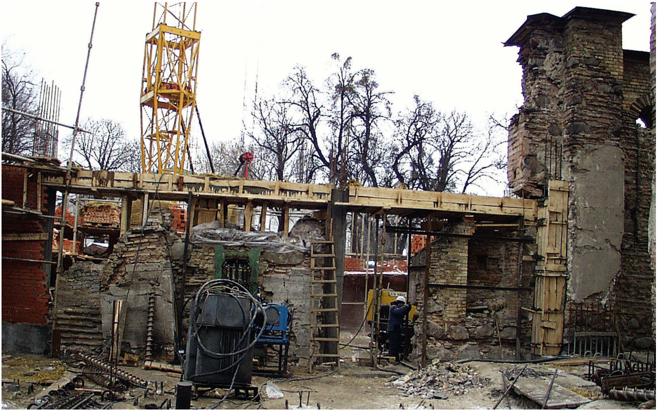
Рис.1. Початок відтворення Успенського собору.

На підставі розпоряджень Президента України Л. Д. Кучми, Голови Київської міської державної адміністрації О. О. Омельченка та Кабінету Міністрів України, у відповідності до затвердженої концепції відтворення стінопису Успенського собору Києво-Печерської лаври в складі погодженого ескізного проекту, в лютому 1999 року було затверджено завдання на проектування інтер'єру Успенського собору. Основою для проекту відтворення інтер'єрів собору стали малюнки академіка Ф. Солнцева 1840-х рр., описи собору різного часу, світлини та гравюри, які були використані для побудови фасадів та інтер'єру за допомогою методу фотограмметрії, що дозволило більш точно провести відтворення собору з його складним архітектурним декором, деталями, керамічними розетками і живописом.