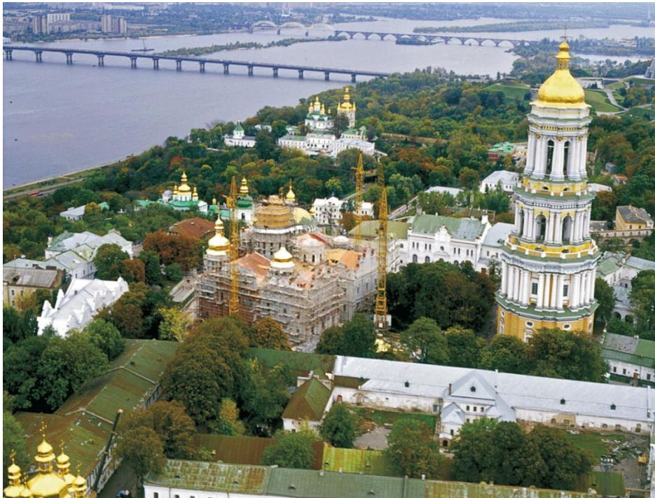
Рис.2. Завершальні етапи відтворення. Влаштування покрівлі та бань Успенського собору

Весь технологічний цикл від заготівлі деревини до остаточного монтажу виготовлених деталей іконостасу був своєрідною реконструкцією давнього технологічного процесу з поправкою на сучасні умови. Одним з найважливіших завдань у цьому процесі було створення шаблонів-лекал окремих деталей різьблення на основі архітектурного проекту та ілюстративного матеріалу. Написанням ікон займалися художники інституту «Укрзахідпроектреставрація». Виготовлення головного іконостасу Успенського собору відбувалось відповідно до програми з 93 ікон, розробленої на підставі архівних джерел. Всі назви і сюжети ікон відповідали архівним свідченням. Проект реконструкції головного іконостасу був розроблений інститутом «Укрпроектреставрація» в майстерні під керівництвом О. О. Граужиса. Враховуючи недостатність архівних джерел, зразками для написання ікон також були старовинні українські ікони та гравюри кінця XVII-XVIII століть, гравюри до Біблії Піскатора та Г. де Йоде, а також акварельний малюнок іконостасу Ф. Солнцева та описи ікон XVIII ст.