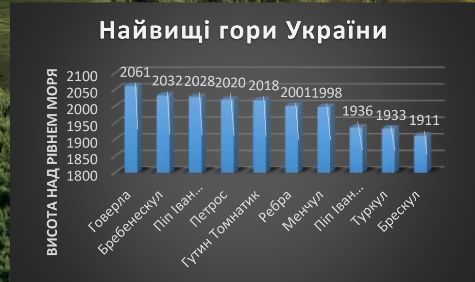
Висота найвищих гір України