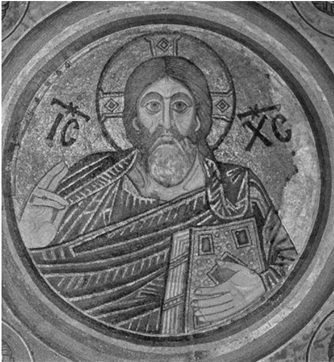
Рис.3. "Христос-Вседержитель" ("Христос-Пантократор"). Мозаїчне зображення. Головний купол.