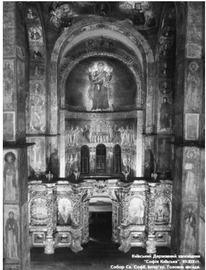
Рис.7. Головна апсида собору.

2) малювання кальок з оригіналів збережених мозаїк XII століття з розбивкою зображення на окремі кубики смальти з зазначенням їх кольору та рельєфу поверхні;