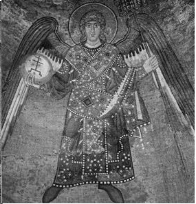
Рис.4. "Архангел Михаїл". Мозаїчне зображення. Головний купол.

В результаті досліджень 2006 року встановлено, що товщина тинькувального шару, нанесеного в три шари, разом із мозаїчним набором становить 5-6 см, причому найміцнішим є верхній шар тинькувальної основи, найслабшим – нижній шар, причому причиною низької міцності нижнього шару тиньку є не склад розчину, а деструктивні процесами, що відбулися в ньому під негативним впливом зовнішнього середовища.