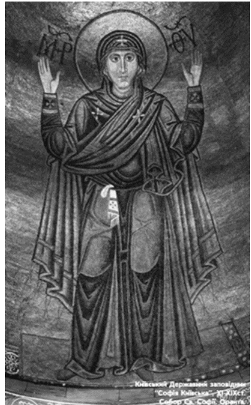
Рис.5. “Богоматір Оранта”

В 1980-х роках проводились роботи з укріплення мозаїки “Богоматір Оранта” в Софійському соборі (рис. 5).