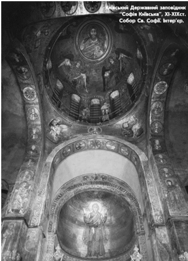
Рис.6. Інтер'єр собору.