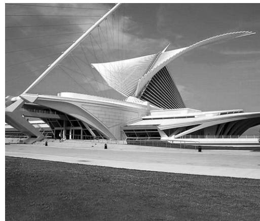
Розширення художнього музею США, Мілуокі, 2001 р. арх. С. Калатрава