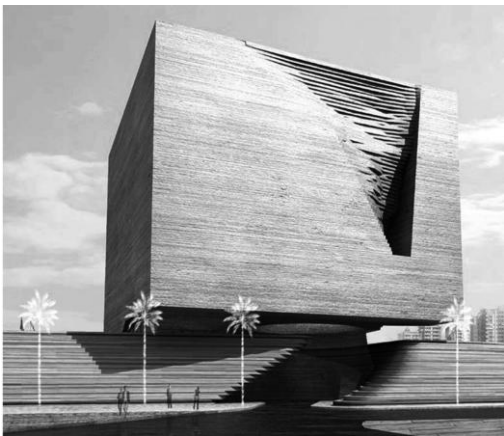
Художній музей NURAGIC, Італія, Кал’ярі, Сардинія, 2007 р. арх. Ф. Праті та MDU

На кінець ХХст. в проєктуванні музеїв склалось дві течії, що сповідують експресивно – деструктивний напрямок (арх. Ф.Гері, Д.Лібескінд, З.Хадід) та мінімалістський, що надавав перевагу функціональній організації (арх. Людвіг Міс ван дер Рое, Т.Андо, А.Аалто, Й.Танігучі) [3]. Аналізуючи специфіку цих напрямків слід відзначити право на існування обох течій, що забезпечують розвиток та поступ архітектури художніх музеїв.