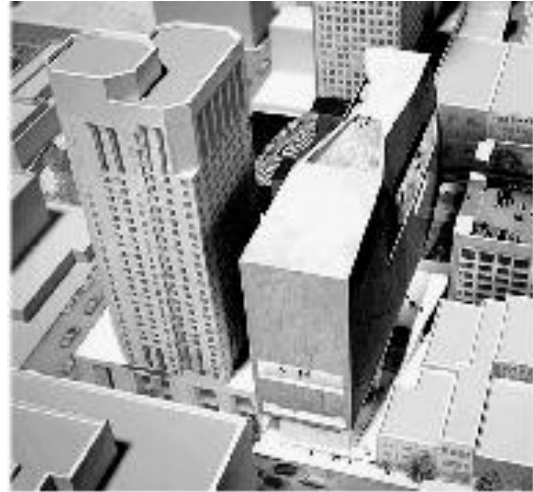
Музей сучасного мистецтва Сан-Франциско, США Snohetta

Розширення музею Джосліна виконано з урахуванням архітектурно – художньої естетики основної будівлі та її розширення (“погодження естетики основної будівлі та її розширення”). Нове крило виконане з урахуванням пропорцій, оздоблення фасадів здійснено з використанням аналогічних матеріалів існуючого музею.