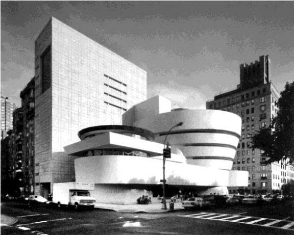
Музей С.Гуггенхайма у Нью-Йорку, 1959р., Gwathmey Siegel & Associates Architects