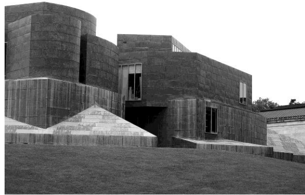
Розширення музею Толедо, США, 2007р., арх. К.Седзіма, Ryue Nishizawa