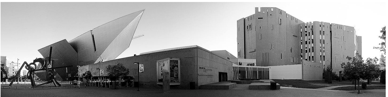
Розширення Музею мистецтв, Денвер, США, 2006р., арх. Д.Лібескінд

Музей в місті Денвер зазнав двох розширень, останнє з яких належить арх. Д.Лібескінду. Якщо перше враховувало основні елементи, щоб не протистояти основній будівлі, то останнє зовсім не враховує існуючі дві будівлі і контрастує з існуючими.