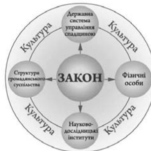
Мал. 5. Загальна організаційна модель управління історико-культурною спадщиною

Аналізуючи досвід та діяльність інших країн, найбільш успішних у сфері збереження історико-культурної спадщини, була виявлена єдина для всіх країн організаційна модель управління історичними об'єктами (рис.5)