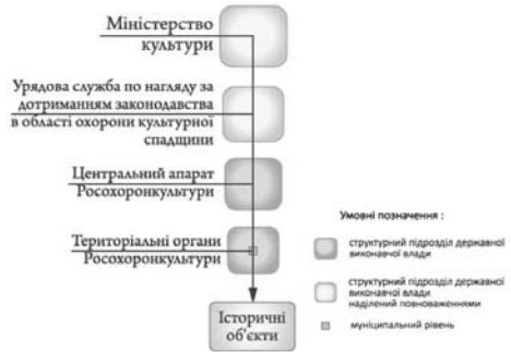
Мал. 4. Схема державної системи виконавчої влади Росії в області збереження історичної спадщини

В Росії сучасна система охорони історико-культурної спадщини, як і в період Радянського Союзу, тяжіє до азійської групи країн[2]. Це проявляється у жорсткій системі урядової влади і централізованому державному фінансуванні реконструкції та утримання (витрати на експлуатацію) історичних об'єктів(рис.4). У спадок від Радянського Союзу новій Росії досить відпрацьоване та сформоване законодавство по охороні пам'яток історії та культури. Власних об'єкту культурної спадщини несе відповідальність за його утримання, який внесений до реєстру, або виявленого об'єкту культурної спадщини, с врахуванням вимог Федерального закону. В Росії не розвинена економіка збереження спадщини, а також повністю відсутній приватний інвестиційний сегмент.