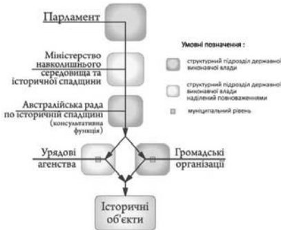
Мал. 3. Схема державної системи виконавчої влади Австралії в області збереження історичної спадщини