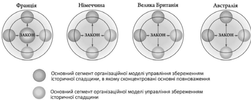
Мал. 6 . Європейська модель управління збереженням історичної спадщини

При відсутності того чи іншого сегменту в моделі відбуваються процеси, які руйнують чи впливають на інвестиційну привабливість використання історичного об'єкту. Тільки при наявності та взаємодії всіх чотирьох сегментів держава має можливість зберігати історичні об'єкти. До держав, що мають єдину модель, відносяться країни Європи, Північна та Південна Америки, а також Австралія (мал.6).