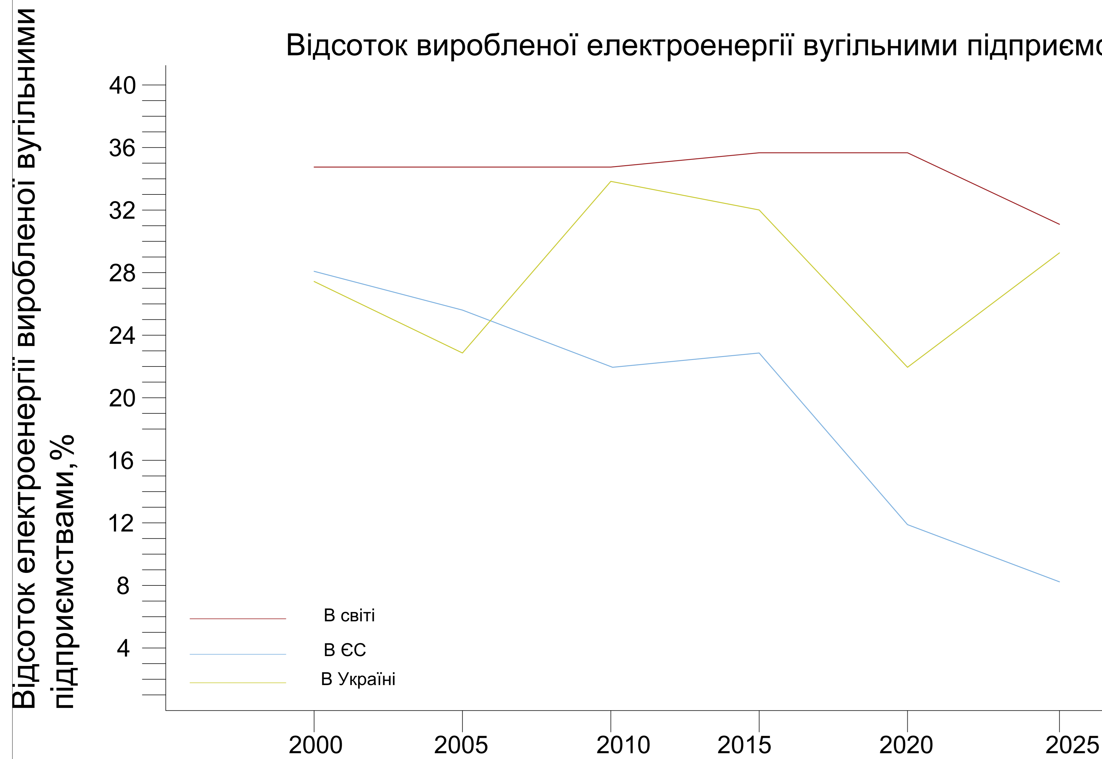
Відсоток виробленої електроенергії вугільними підприємствами