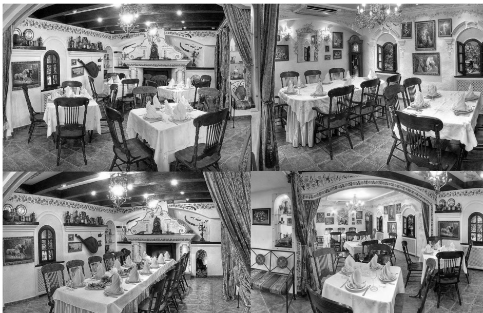
Рисунок 2. Інтер'єр ресторану «Хатинка» м. Київ, 2009 рік, майстер: Галина Назаренко.

Розкриваючи основні механізми застосування петриківського розпису в сучасних інтер'єрах громадських будинків і споруд варто відзначити сучасне оформлення ресторану «Хатинка». Весь інтер'єр «Хатинка» просякнутий і відтворений в кращих традиціях української хати. Тут є навіть невід'ємна частина старовинного будинку – справжня піч, яка прикрашена петриківським розписом, та прядка з веретеном – обов'язкове ноу-хау українського дому в старовину, рис. 2.