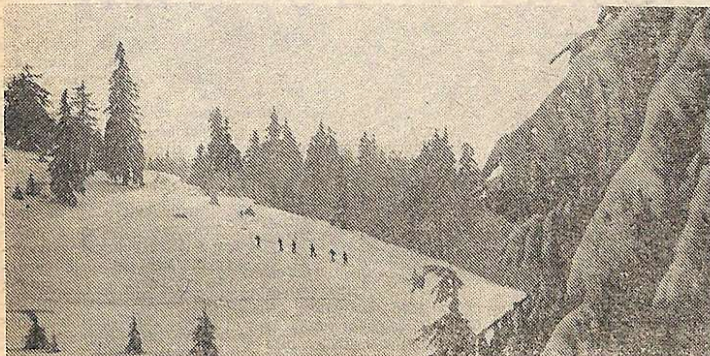
На знімку: карпатський гірський пейзаж.