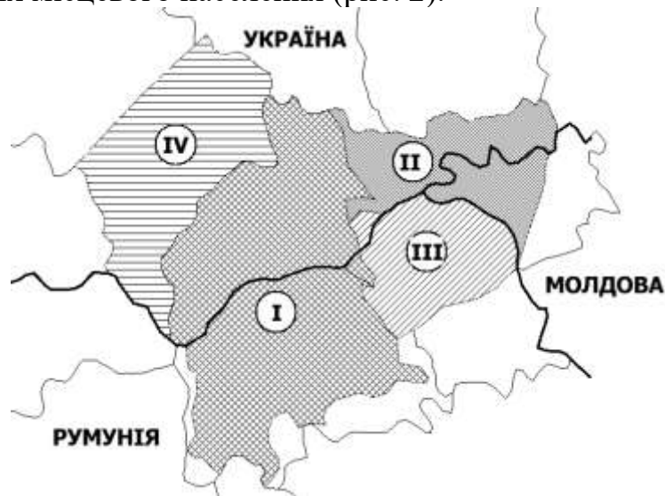
Рис. 2. Історичний регіон Буковини: I – завжди; II – часто; III – інколи; IV – рідко

Огляд історичних джерел, а особливо – картографічних дозволяє сформулювати уявлення щодо територіальних меж історико-географічних регіонів та уявлень про них місцевого населення (рис. 2).