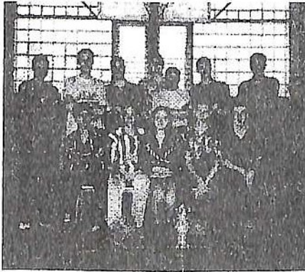
На знімку: збірна університету КДТУБА.

Після урочистого представлення команд, розпочалася перша гра, у якій збірна КДТУБА зустрілася із командою юніорів «Школярі» - ось як домовилися називати хлопців цієї збірної усі глядачі. І справді, у першій половині матчу перевага студентів була відчутною. Поступаючись у зрості, фізичних кондиціях, юніори програвали боротьбу під щитами, а на майданчику виглядали справжнісінькими школярами. Як наслідок, перший період закінчився з розгромним рахунком 31:4 на користь студентів.