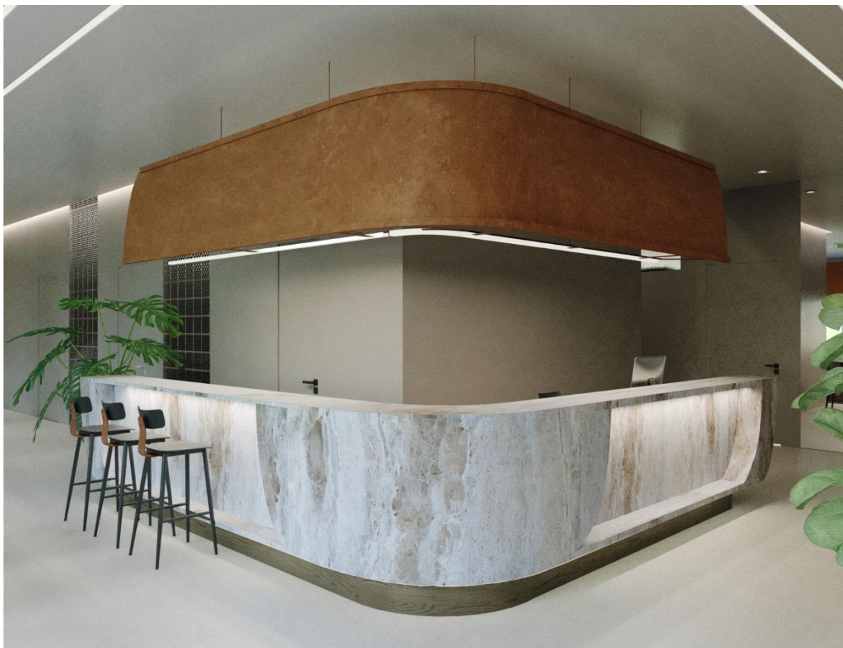
Рис. 3.1 Стійка рецепції – чайного бару в інтер'єру

Так як елемент інтер'єру повинен виконувати декілька функцій, у тому числі зонувального розмежування та лінійний напрямок самого простору, конструктивні рішення мають відповідати ергономічним принципам проектування обох залучених процесів взаємодії працівників з відвідувачами, створювати перше вагоме враження клієнта від простору.