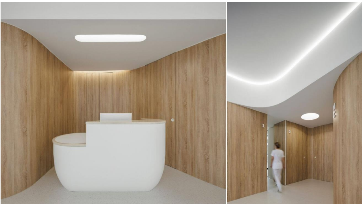
Рис. 3.1 Tsou Arquitectos, 2022, Руа Д. Жуліо Таварес Ребімбас, Майя, Португалія.

[ MOOD Medicina Dentária: An organic clinic | Dental Clinic (amazingarchitecture.com) ]