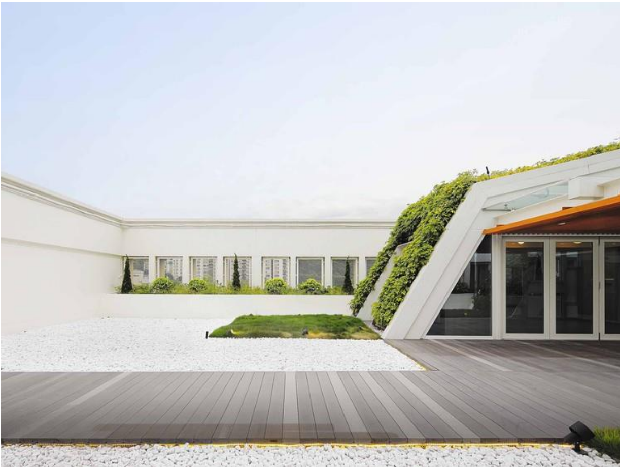
Рис 1.1 SK Yee / Ronald Lu & Partners (центральна вхідна зона)

https://images.adsttc.com/media/images/54c0/6dc1/e58e/ce1a/bf00/02c7/newsletter/2_This_%C3%94%C3%87%C2%A3lean_and_green%C3%94%C3%87%C3%98_building_turns_an_empty_roof_into_a_meaningful_space..jpg?1421897126