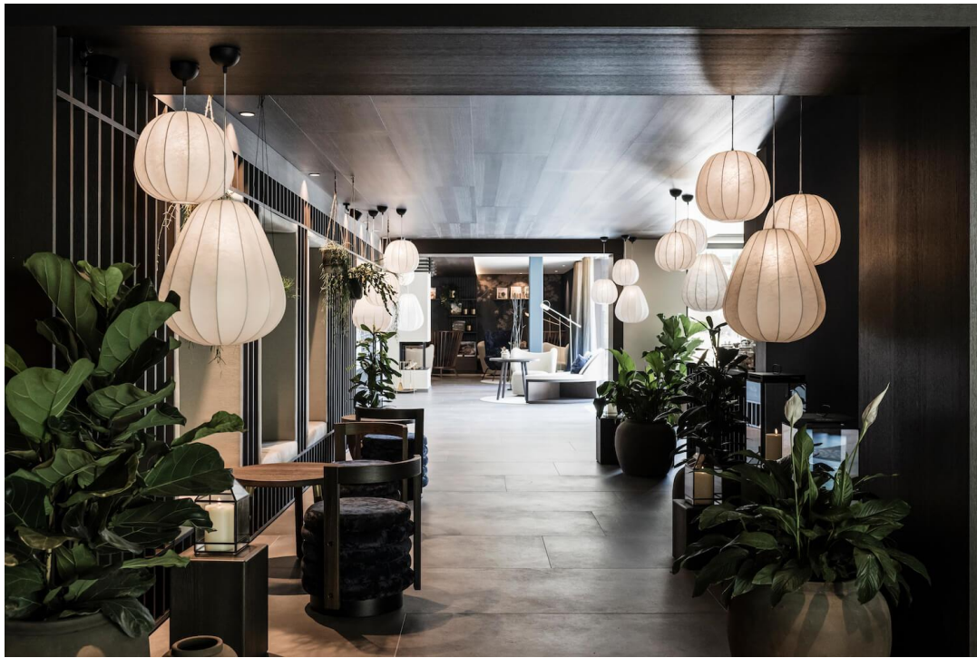
Рис. 3.2; 3.3 Noa* network of architecture; 2022 [ Silena: The Alps meet Asia by noa* netwo|Hotel (amazingarchitecture.com) ]

Відвідувачів вітають у відкритому просторі, і око може вільно петляти вздовж осі. Ця розслаблююча атмосфера запрошує гостей відпочити та випити після прибуття. Кам'яний фонтан, новий дизайн камінної зони та затишні алькови для сидіння зменшують жорсткість класичної реєстрації. Цей намір підкреслюється розміщенням ресепшн збоку. Відгомін Азії ледь помітний, але всюдисущий і виявляється у формі темного дерева в поєднанні з відтінками синього та сірого, ніжних соснових дерев бонсай у керамічному посуді, вертикальних валунів із місцевого каменю та дискретних вогнів у формі ліхтарів.