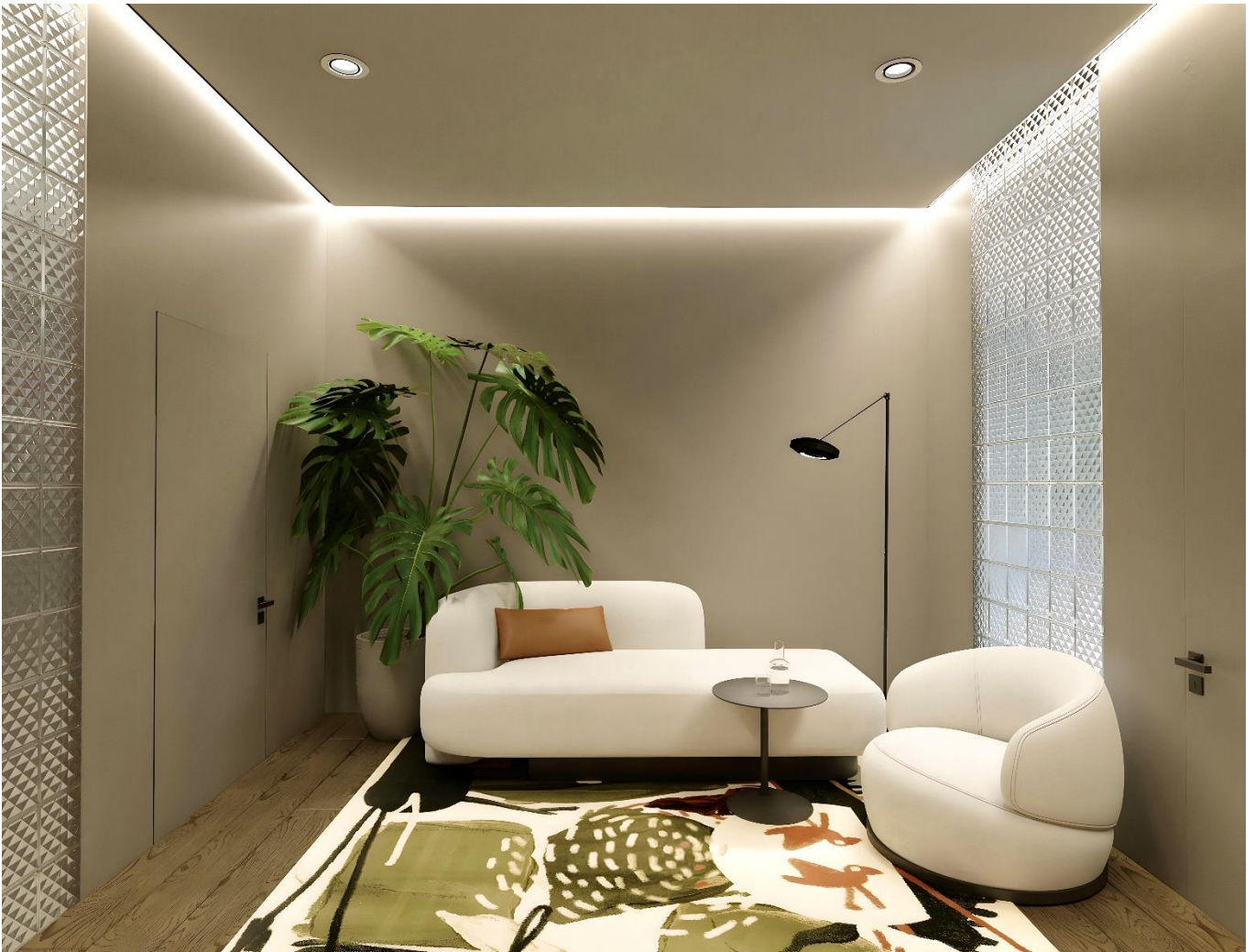
Рис. 2.6 Кабінет психолога

Що стосується залу групових занять, вирішено створити якомога вільніший простір, адже приміщення розраховане на 13 осіб, для комфортного розміщення при виконанні вправ. Тому, найкраще – це мінімум меблевих елементів, які заміняє самостійна стійка зі зняттям (килимки, скакалки, тощо). Натомість, для візуального розширення простору, одна зі стін облицьована дзеркальними панелями, що, у свою чергу, допомагає відвідувачу перевірити правильність виконання тієї чи іншої вправи, або прослідкувати прогрес.