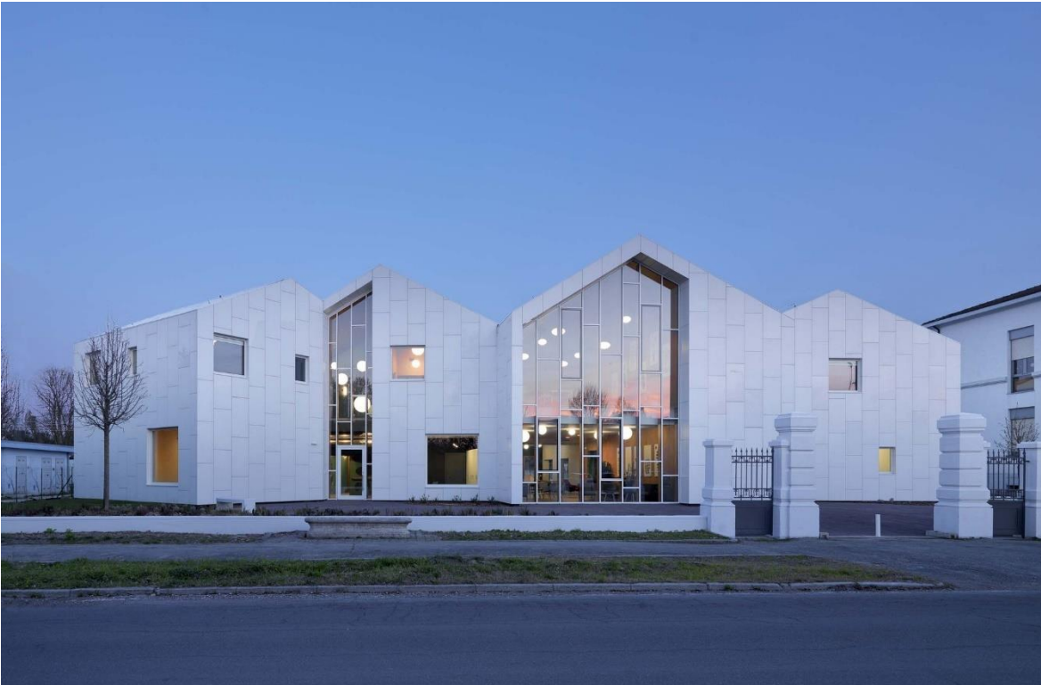
Рис 1.7 Соціально-оздоровчий центр «Workshop Ricostruzione» [ https://www.archdaily.com/942441/workshop-ricostruzione-the-social-health-center-mc-a ]

Центр соціального здоров'я в районі Сан-Феліче-сульт-Панаро надаватиме послуги людям з обмеженими можливостями, а також надаватиме медичні послуги для дев'яти міст на півночі Модени. Земля навколо будівельного майданчика заповнена різними культурами, які надихнули форму будівлі сараю, і ці знайомі образи створюють відчуття безпеки для мешканців. Соціально-оздоровчий центр розділений на два поверхи, на першому поверсі розташована зона активності, а на верхньому – зона відпочинку. Будівля складається з 4 взаємопов'язаних об'ємів, які видно лише ззовні, а інтер'єр є суцільною просторовою формою.\