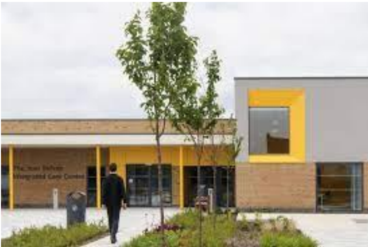
Рис 1.5, 1.6 Оздоровчий центр «The Jean Bishop Integrated Care Centre», вхідна центральна зона і креслення вид з різних сторін

[ https://www.archdaily.com/909641/the-jean-bishop-integrated-care-centre-medical-architecture ]