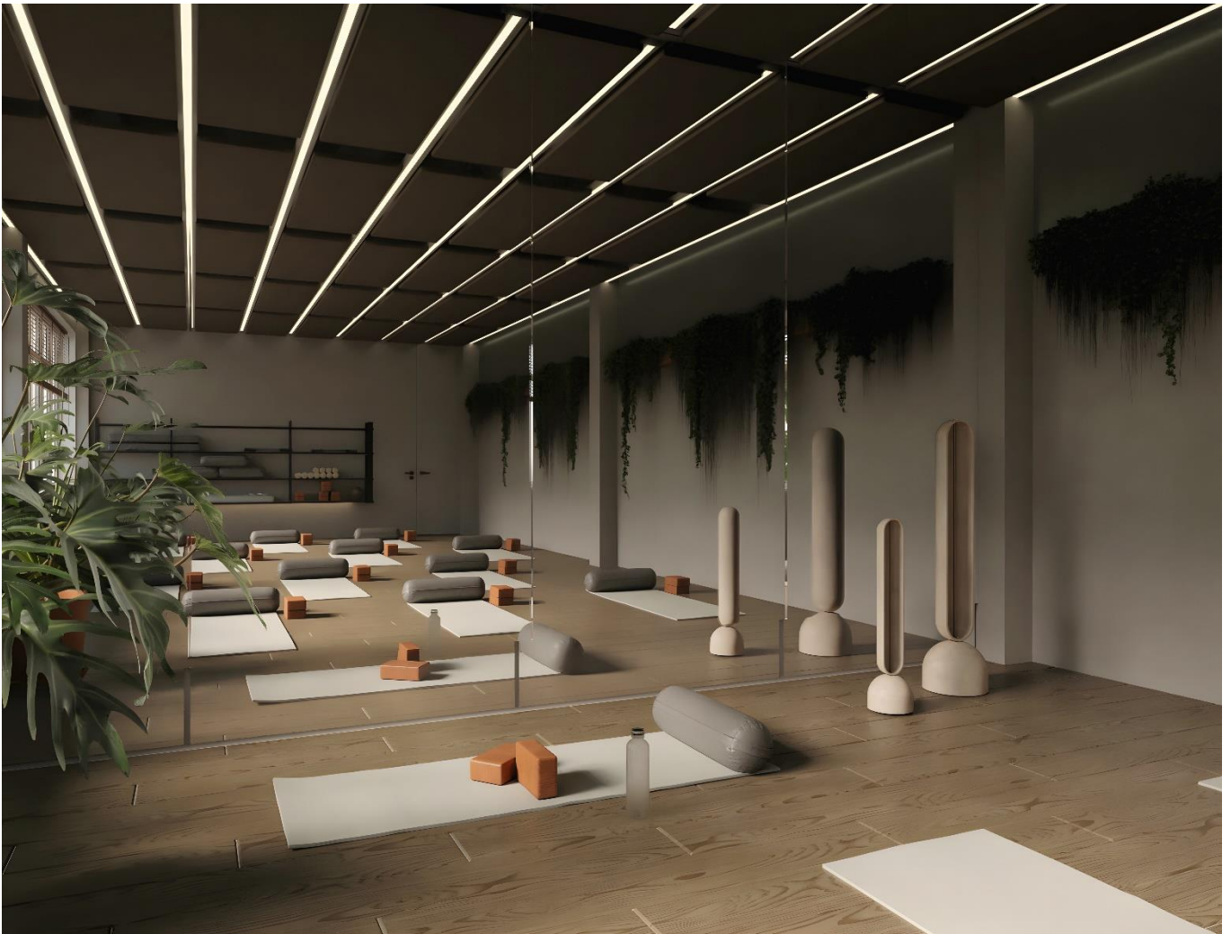
Рис. 2.7 Інтер'єр зали групових занять

Обране поєднання стилю та прийомів, транслює потрібну для реабілітації філософію, що відображається у формах, тонах. Підсилюють ефект різні, безпечні рослини, які крім композиційних, виконують естетичні задачі, у комбінації з приронім та штучним світлом.