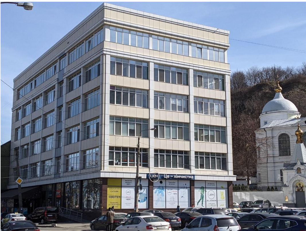
Рис. 2.3 Зображення фасаду будівлі [Оренда Офіс вул. Верхній Вал 2а Київ - ціна 3700