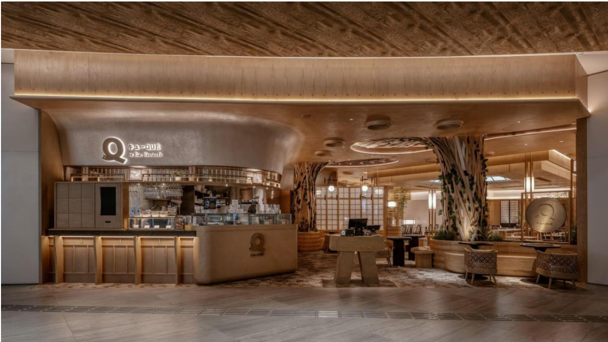
Рис. 3.4 Minus Workshop; 2022 [ https://amazingarchitecture.com/restaurant/que-citygate-hong-kong-by-minus-workshop ]

Однією з визначних естет дизайну є відзначення та цінування мистецтва природи, навіть живучи в міському ландшафті. Зелень всюдисуца, але в іншій формі, яка не очікувала. У QUE невичерпна сила стародавніх дерев, покритих смугами деревини та виноградної лози, обрамляють вхід, а також зв'язування від стелі до бару, який лежить у просторі, додає динамічної перспективи та руху. Відвідувачам пропонують почати подорож і зануритися в бонсай вабі-сабі.