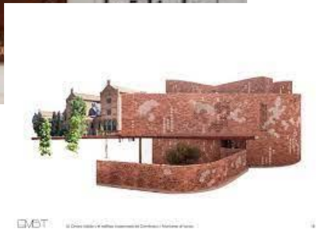
Рис. 1.2, 1.3, 1.4 Оздоровчий центр «Kálida Sant Pau Center, центральна вхідна зона, вид збоку та модель проєктування)

[ https://www.archdaily.com/916960/kalida-sant-pau-center-miralles-tagliabue-embt ]