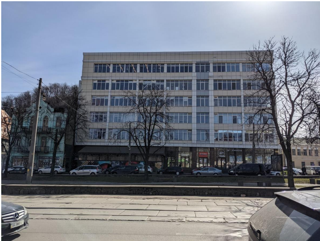
Рис. 2.2 Зображення фасаду будівлі [Оренда Офіс вул. Верхній Вал 2а Київ - ціна 3700 грн. W-6983751 | 100realty.ua]