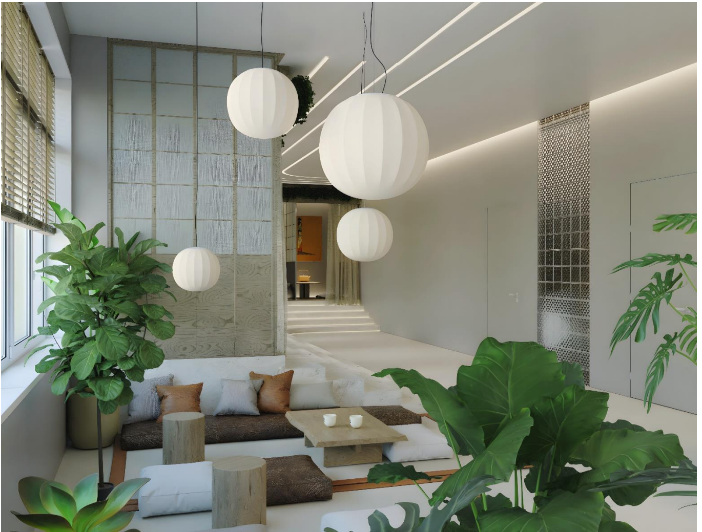
Рис. 2.5 Інтер'єр зони чайних церемоній

При розробці кімнاتок для комунікацій та відпочинку, першочерговою задачею є відчуття приватності та затишку, що створює безпечну атмосферу для бесід. Це завдання вирішено, за допомогою контрастних перегородок між кімнатками, підвісних рослин, та тюлі, що символізують повітряність та прихисток водночас. Щодо меблевого оснащення кабінетів – вибір відповідає саме практичним задачам, а саме: комфортного положення тіла клієнта, також за його вибором (сидяче, лежаче, напів лежаче). Світлі відтінки стін, дивану, та інших елементів, гармонійно виглядають у ледь затемненому кабінеті. Обране підлогове покриття – паркетна дошка, доповнює затишну, навіть, усамітнену атмосферу.