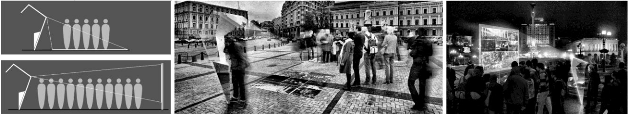
Рис. 3. Колективне використання ІВ за допомогою проєктора.

таких як лавочка, навіс, екран, меморіальний знак. Особливої уваги заслуговує «ІВ» на вулиці Інститутській – місці найдраматичніших подій РГ.