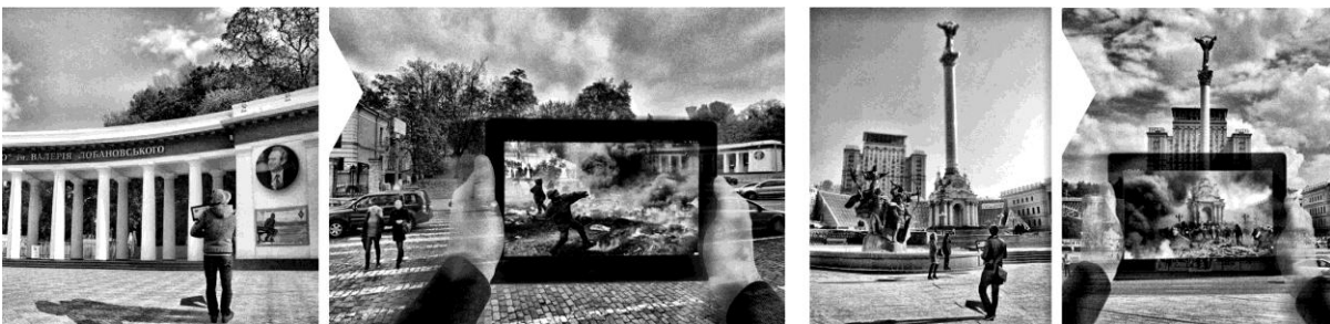
Рис. 5. Використання додатку «побачити як це було».

Розвиток «ІВ» в Києві сприяє не тільки відзначенню основних місць Революції гідності, а також інформуванню людей безпосередньо на місцях