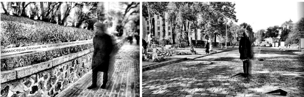
Рис. 4. Меморіал у вигляді стрічки з молитвою та «стежка пам'яті».

У цьому місці пропонується встановити меморіал, у вигляді стрічки, яка врізана в схил вздовж вулиці Інститутської від Жовтневого палацу до станції метро. На стрічці розташовані слова молитви за героїв Небесної сотні, яку можна прочитати, йдучи від Майдану Незалежності до місця масового розстрілу. Ця стрічка символізує останній путь Небесної сотні. Людина, яка йде вздовж вулиці та читає слова молитви, якби молилася за героїв, проходячи їх останні кроки. «ІВ» доповнює це місце, інформуючи про ці трагічні події. За допомогою додатку «побачити як це було» можна дізнатись про події РГ через фотографії, які зняті з цього місця. Таким чином формується «стежка пам'яті» вздовж вулиці (Рис. 4, 5).