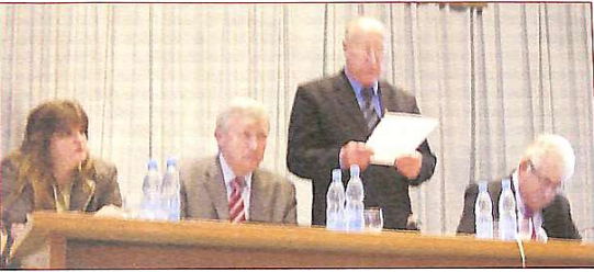
Президія наради-семинара з вступної кампанії у вузи 2009 р.

Міністерство освіти і науки України провело ще такі наради у Львові (Львівський національний університет імені Івана Франка, Харкові (Національний технічний університет "Харківський політехнічний інститут", Донецьку (Донецький національний університет), Одесі (Одеський національний політехнічний університет).