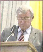
Директор департаменту вищої освіти Я. Болубаш