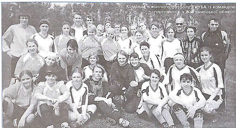
Команда з жіночого футболу КНУБА із командою спортсменок з Житомирської області

Матеріал підготувала Т. Грудинська, студентка