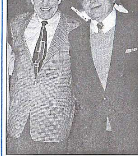
Проф. Хартмут Кьопплер та засл. діяч наук України, проф. В. С. Михайленко

Діти відвідують проф. Кьопплера концертами, організованими власними силами. У таких заходах завжди беруть участь і професійні колективи, які підтримують ідеї товариства "Допомога дітям Чорнобиля" і докладають всіх зусиль до розширення цієї роботи в Україні.