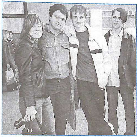
Вивчаємо історію університету