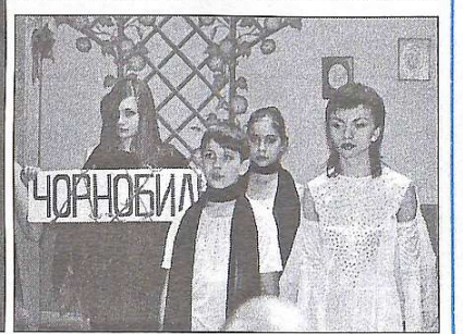
Зразковий ансамбль "Червона калина" під час концерту у Німеччині