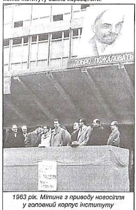
1963 рік. Мітинг з приводу новоствореного корпусу інституту

Відзначаючи вагомий внесок викладачів і співробітників інституту у справу підготовки спеціалістів і у розвиток вітчизняної та світової науки в різних галузях будівництва і архітектури, Кабінет Міністрів України Постановою № 646 від 1993 р. прийняв рішення про утворення на базі КБІ Київського державного університету будівництва і архітектури. 26 лютого 1999 р. Указом Президента України університет набув статусу національного.