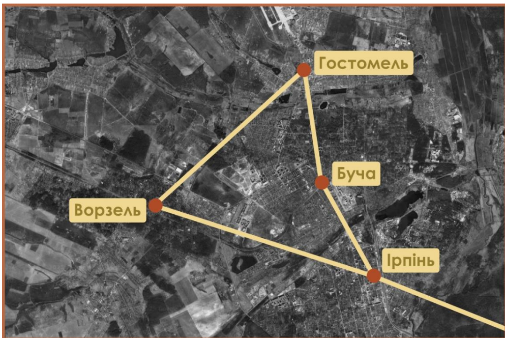
Ілюстрація №2. Збільшений фрагмент карти