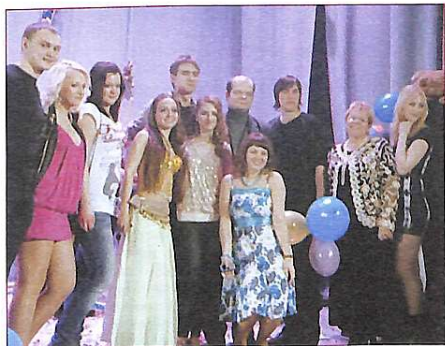
Команда будівельного під час IV туру концерту "Прокінься і співай"

Р.С. На мою думку, виступи були: у кого більш вдалі, в кого менш... Загалом – чогось кардинального більшість команд показати не зуміли.