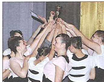
Перемогою дівчата задоволені!