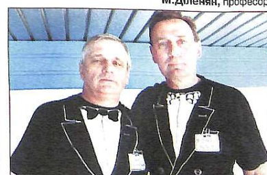
МС Ю.Човнок та ЗМС, чемпіон Олімпійських ігор С.Фесенко

НАШ САЙТ В ІНТЕРНЕТІ: www.knuba.edu.ua , e-mail: arh_bud@knuba.edu.ua