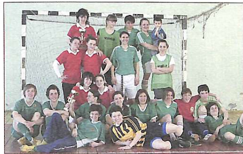
Команда КНУБА з жіночого футболу

15-16 квітня 2011 року вперше було проведено відкритий чемпіонат КНУБА з міні-футболу серед жінок. Попередньо було заявлено 8 команд, однак участь взяли 4 команди. Відома команда України "Белчанка-НПУ" – Національний педагогічний університет, "Александрія", "NRG".