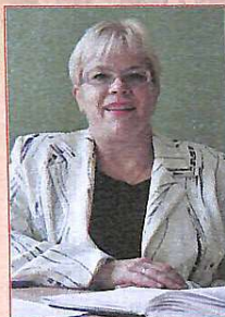
Іде: студенти сприймають викладачів як старших колег, а до формальних відносин додаються чисто людські, створюється сприятлива для студента атмосфера, в якій він відчуває себе більш впевнено.

Часто у вузах існує думка, що між викладачем і студентом повинна бути межа, дистанція... Її тримають перш за все самі викладачі, не допускаючи студентів на свою "особисту територію". Однією з причин цього є, що старші люди думають: якщо вони почнуть ставитися до студентів, як до рівних, то авторитет викладача впаде і в очач молодих викладач втрачатимуть свій статус.