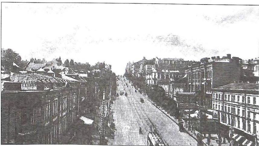
Фундуклеївська (тепер Б.Хмельницького) вулиця. Поч...XX стол.