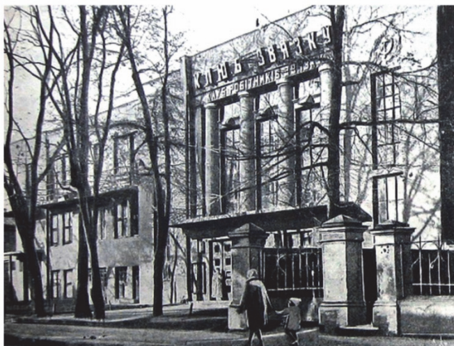
1. Селянський поземельний банк, (зараз — головний корпус ХНПУ ім. Г.С. Сковороди), 1914 р. Сучасний стан. 2. Комплекс інституту наукової та практичної ветеринарії. Вид з боку головного входу (фото 1930-х рр.). 3. Будівля Держстраху (зараз — головний корпус ХНУБА), 1927–1929 рр. Загальний вигляд (фото 1940-х рр.) 4. Комплекс студентських гуртожитків «Гігант», 1925–1929 рр. Вид збоку вул. Пушкінської (фото 1930-х рр.). План. 5. Клуб Печатників, 1927 р. Головний фасад. 6. Клуб робітників зв'язку, 1929 р. Загальний вигляд (фото 1930-х рр.)