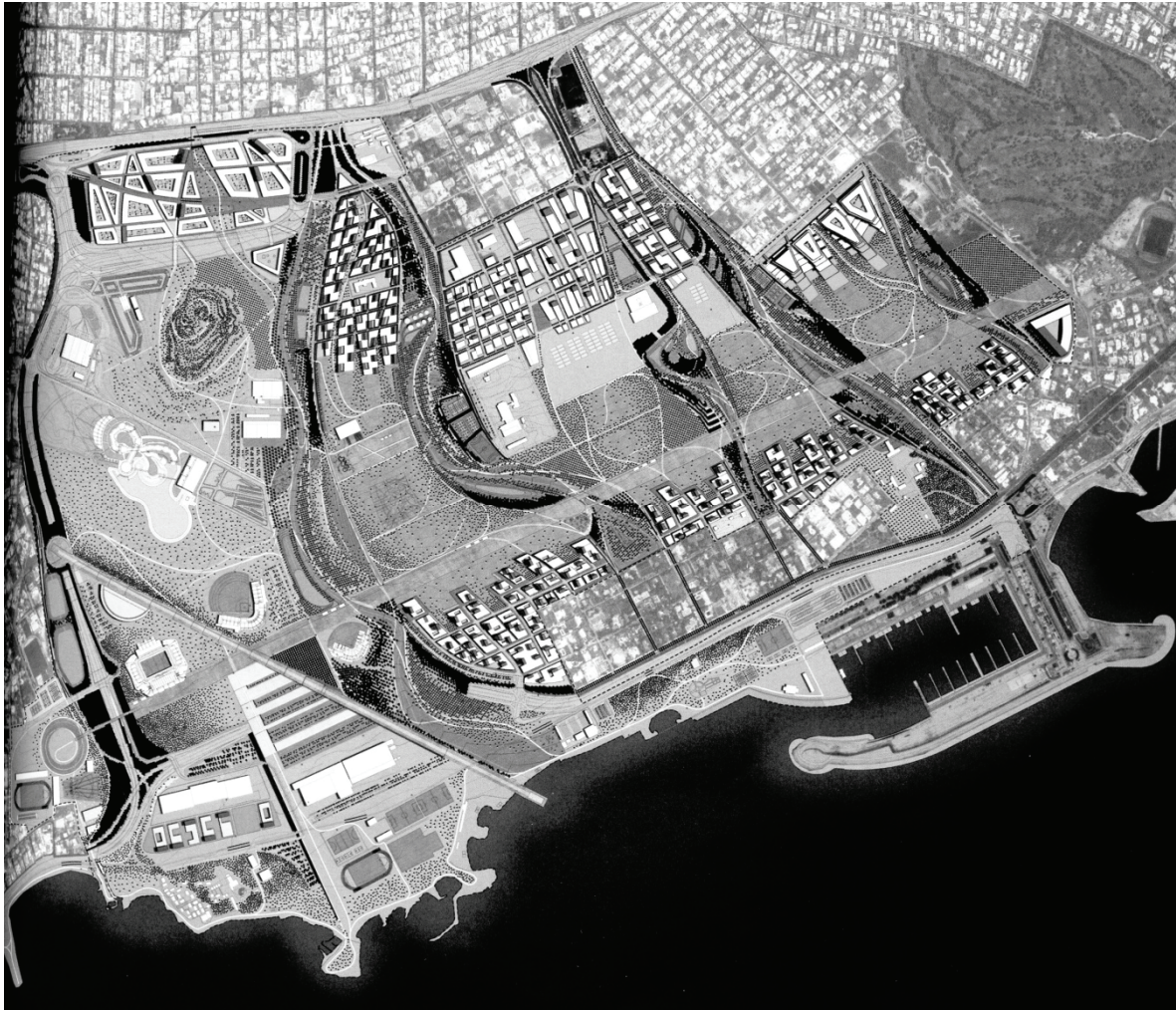
Рис. 4. Генеральный план парка Хелленион (Афины).

Молодой архитектор Давидас Сереро, опираясь на особенности локальной гидрологической и планировочной системы, вводит новые понятия, определяющие структуру парка: softscapes (элементы благоустройства и озеленения), hardscapes (малые архитектурные формы).