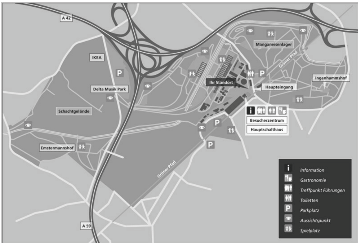
Рис. 2. Генеральный план: старый завод и новый план.

Еще одним примером может послужить Парк ля Виллетт в Париже. Парк ля Виллет во французской столице размещен на месте бывшей скотобойни. Во второй половине XX века эта местность была хорошо известна всем скототорговцам, так как здесь располагался рынок, где можно было приобрести или продать скот.