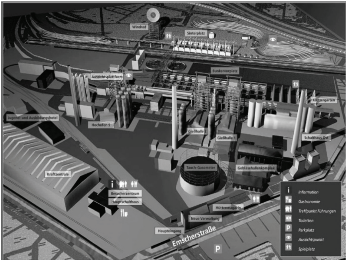
Рис.1. Перспективное изображение завода, реконструированного в парк «Дуйсбург-Норд»

Ежегодно парк посещает более 500 000 гостей. По обширной территории бывшего завода пролегает маршрут «История развития промышленности», здесь также находятся учебная ферма, многочисленные сады, лужайки и водоемы. В парке, в бывшем резервуаре для газа, расположен крупнейший искусственный дайвинг-центр Европы. Доменная печь преобразована в смотровую площадку. Стены завода стали горами для скалолазания; хранилище для руды используется для площадок для игры в хоккей и футбол, соревнований по скейтбордингу.