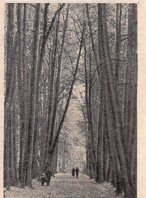
Пізня осінь.