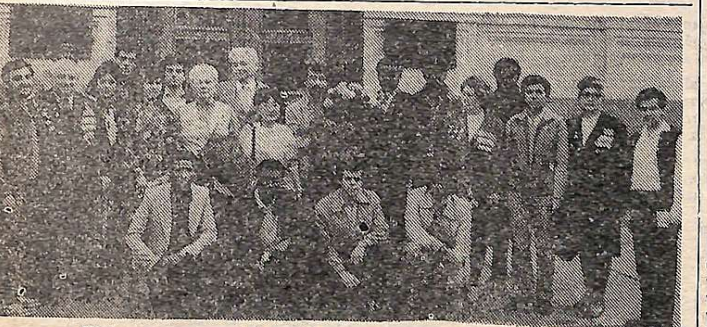
Щороку напередодні Дня Перемоги студенти-іноземці нашого інституту разом з респівниками з інших вузів міста зустрічаються з ветеранами Великої Вітчизняної війни в Українському товаристві дружби і культурних зв'язків з зарубіжними країнами. «Ні — війни!» стає референом дружніх обмінів думками молоді і записників Радянської Вітчизни. На знімку: група учасників зустрічі.