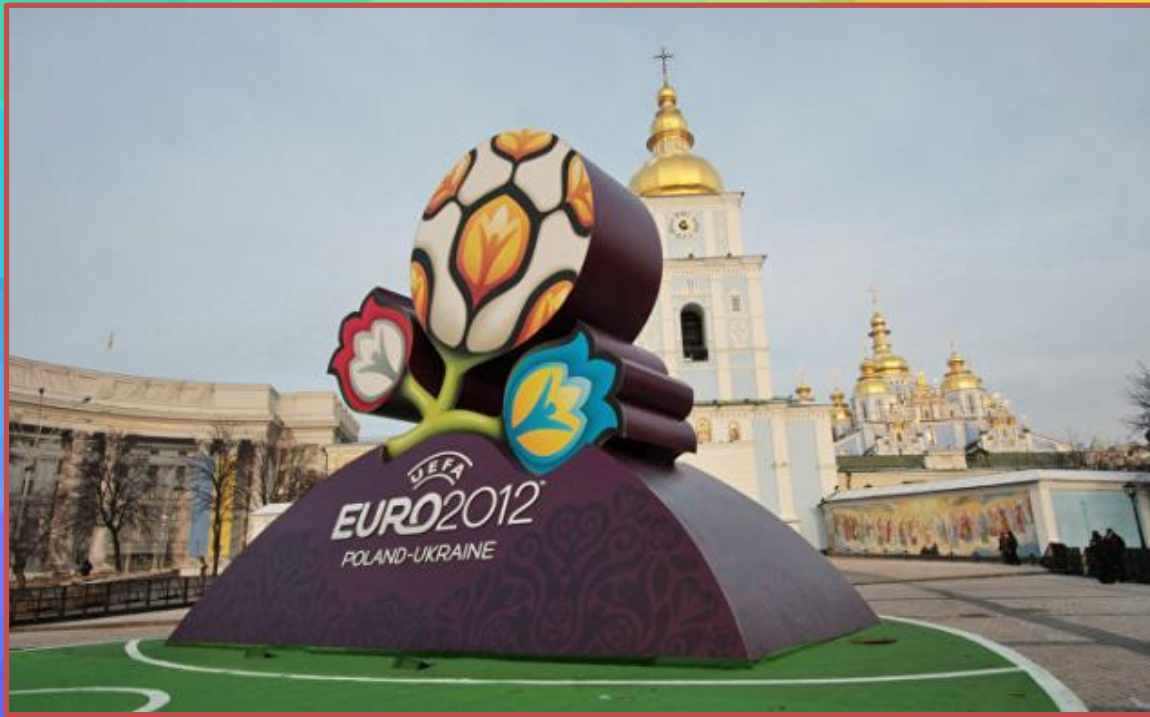
Євро 2012 в Києві

Глобальна подія для міжнародного туризму в Україні – це Євро 2012