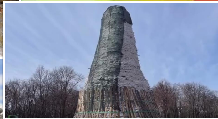
Пам'ятник Шевченку закритий мішками