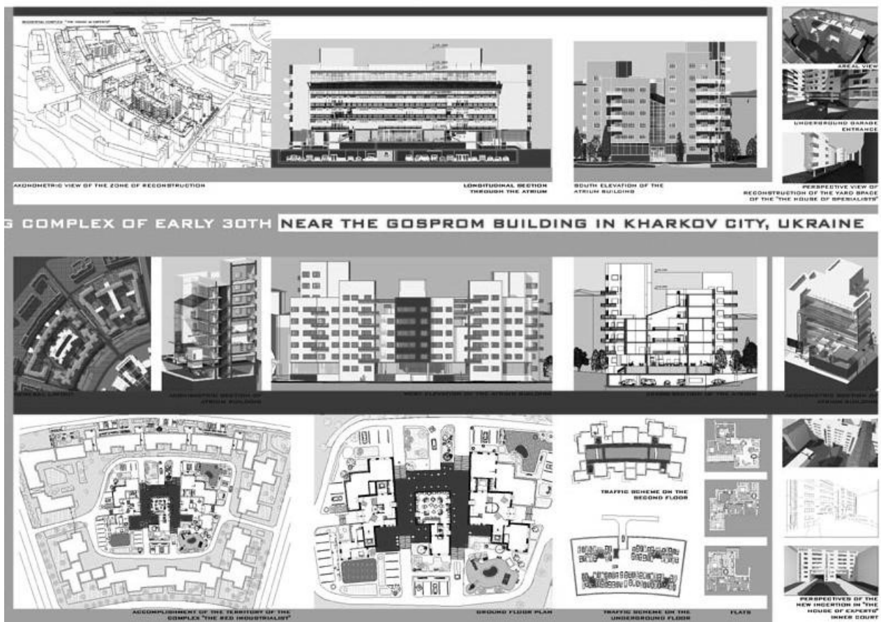
Рис.2. Проект ущільнення забудови житлового комплексу (поч. 1930-х рр.) біля будівлі Держпрому у Харков. Студ. А. Чабаненко, керівник – проф. О. Буряк, 2003 р. Харківський національний університет будівництва та архітектури

Цікавим принципом роботи з радянськими дворовими просторами Одеси 1920-х – 1950-х рр., які розташовані поблизу центру міста, могло би стати і контрольоване ущільнення забудови. Так, наприклад, в столиці українського авангарду Харкові на початку 2000-х рр. було запропоноване рішення розташування нового житлового будинку в одному із дворів житлового комплексу 1930-х рр. Втілений у життя проект не був [15] (Рис.2).