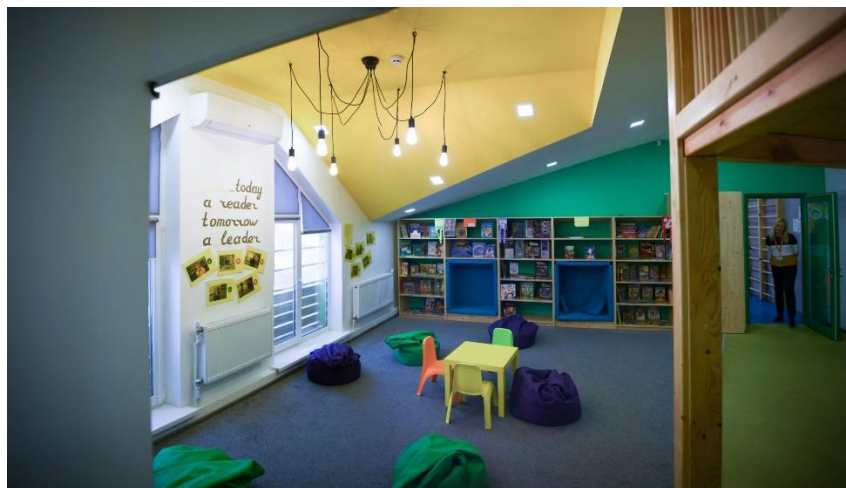
Рис.3.3 Приклад поділу класу на зонування, зона відпочинку та шафки