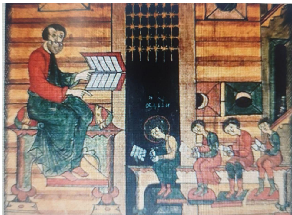
Рис.1.1 Перша школа

Школа була організована і відкрита 27 вересня 1860 року. Першим приміщенням, де навчалися діти, була селянська хата, її називали зборень Рис 1.1