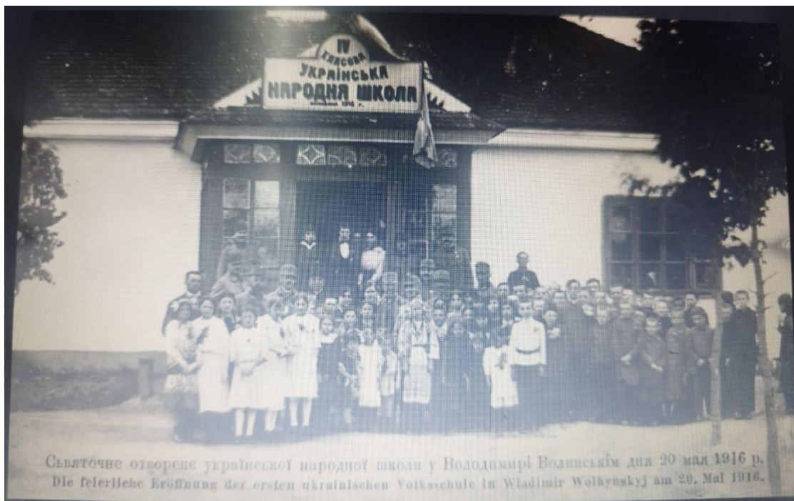
Рис.1.3 Зачатки першої школи в Україні

https://bigkyiv.com.ua/persha-ukrayinska-gimnaziya-tragichnyj-pochatok-suto-ukrayinskoyi-osvity/