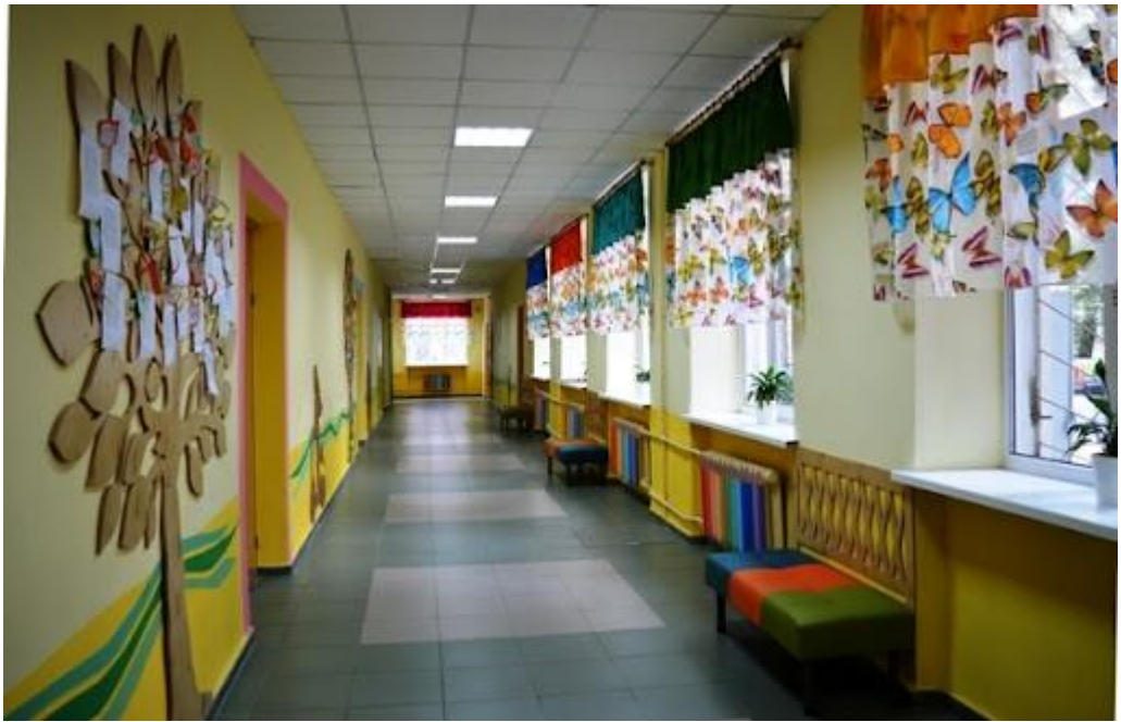
Рис.3.4 Аналог художньо-декоративного оздоблення інтер'єру коридору