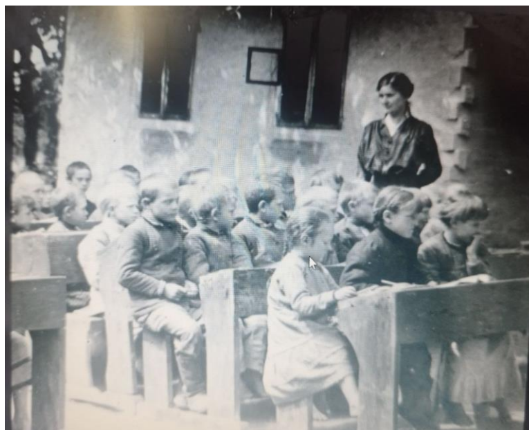
Рис.1.4 Трудова школа

https://bigkyiv.com.ua/persha-ukrayinska-gimnaziya-tragichnyj-pochatok-suto-ukrayinskoyi-osvity/