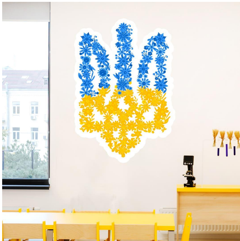
Рис.3.1 Приклад декорування стін