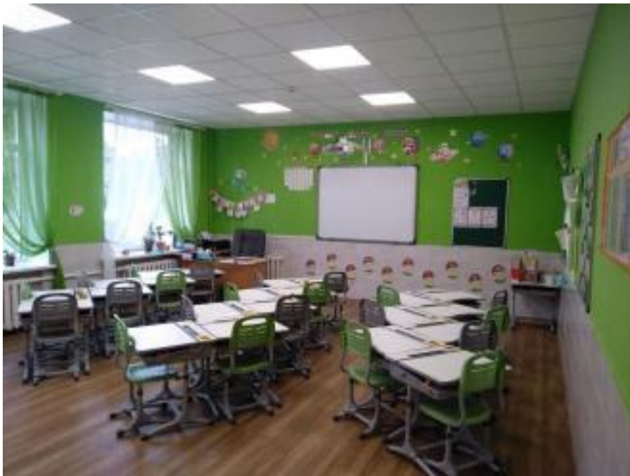
Рис.2.3 Приклад класу з мобільними меблями