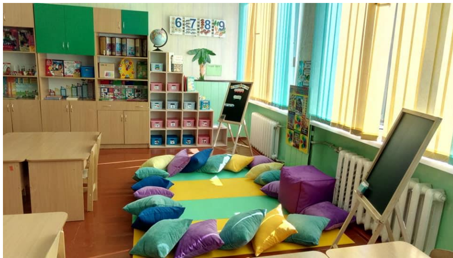
Рис 3.6 Ергономічне зонування класу, приклад