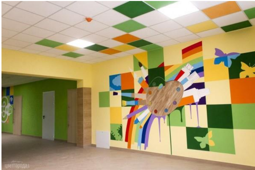
Рис.3.2 Живописне оздоблення стіни