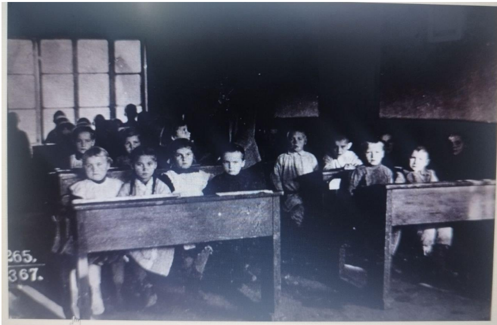
Рис 1.5 Школа на Волині 1916 рік

https://www.volynnews.com/news/all/uchni-ukrayinskykh-shkil-na-volyni-u-1916-rotsi-retrofoto/