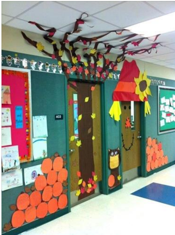
Рис. 3.7 художньо-декоративне оздоблення інтер'єру приміщення школи