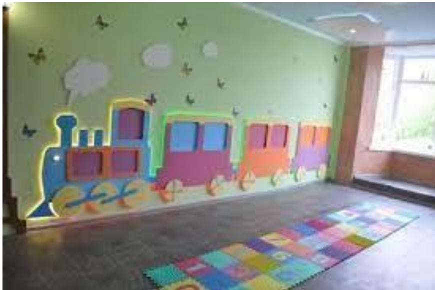
Рис. 3.5 Приклад художньо-декоративного оздоблення приміщення школи