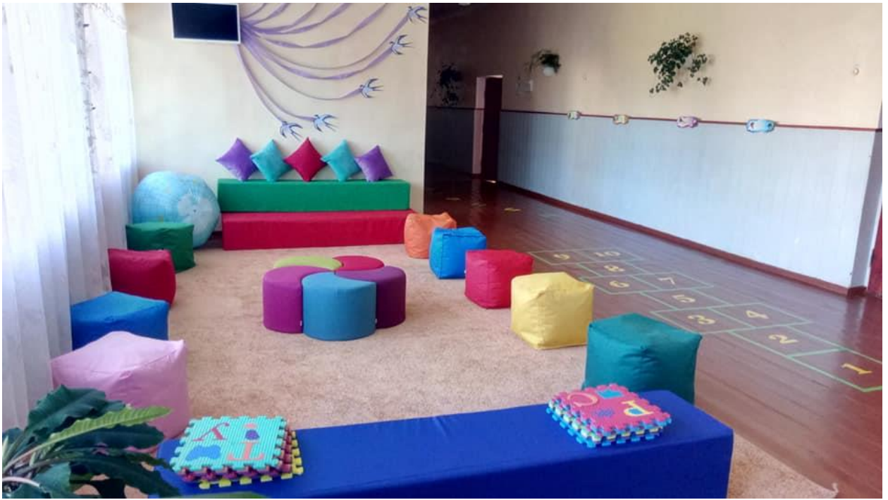
Рис.2.2 Ергономічна зона відпочинку