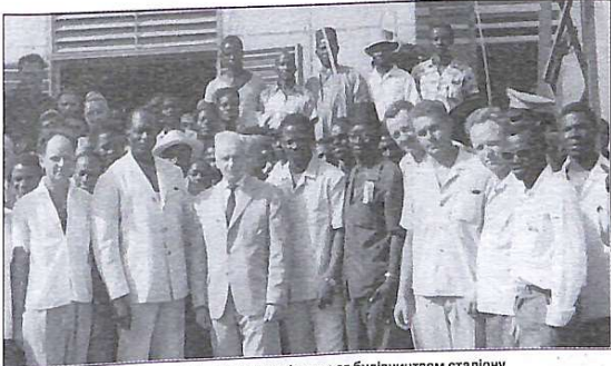
Президент Модібо Кейта цікавиться будівництвом стадіону

— Як вже згадувалося, Організації Об'єднаних Націй (ООН), щоб задіяти Міжнародний центр по будівництву, який мав допомогти побудувати житло країнам, які розвиваються, було доручено сформувати групу міжнародних спеціалістів від країн-учасників Проєкту. Було оголошено конкурс на заміщення посад. Вимоги були досить складними: вища освіта, знання не менше двох робочих мов ООН, фахова підготовка — 5 років, досвід роботи в цих країнах. Учасники конкурсу проходили співбесіду з представником відділу кадрів ООН у Женеві, який мав обрати по одному спеціалісту на кожну посаду. Отже, я був включений і склад Проєкту на посаду інженера від Радянського Союзу. І в січні 1970-го я приїхав у Центр по ліквідації житлових криз у республіку Того.