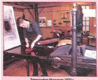
Типографія Маккензі 1850 г.