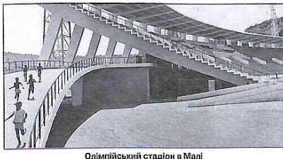
Олімпійський стадіон в Малі