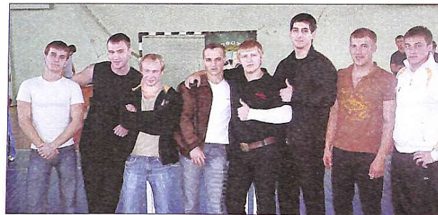
Учасники змагання з армрестлінгу

Раніше газета не писала про ці поєдинки. Тож трохи історії. Армрестлінг – найдавніший вид спорту, який був відомий в 1960-і роки в США. Слово "армрестлінг" походить від злиття двох англійських слів "arm" і "wrestling"; arm – рука, а wrestle, wrestling – завзята боротьба. Тому армрестлінг – вид спортивної боротьби – поєдинок на руках, на спеціальних столах, де учасники змагання стелять лікті на стіл, зчіплюють руки і намагаються пересилити один одного і тим самим покласти руку суперника на поверхню столу. Починаючи з 1997 року, армрестлінг стали називати армспортом, а армрестлерів армборцями. Армрестлінг – широко популярний вид спорту, по якому проводяться чемпіонати світу, змагання різних країн і регіонів.