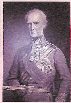
Первый мэр г. Торонто сэр Вильям Маккензи. 1834

В старой типографии с оборудованной 1830-х годов нас встречает очаровательная молодая женщина, одетая в стиле эпохи Маккензи с грубым фартуком поверх клетчатой юбки, подробно рассказывает историю издательского дела и показывает ювелирную технику (если не сказать — каторжную) ручного набора текстов из отлитых металлических букв. Для закрепления знаний каждый из гостей де-