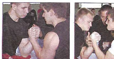
Під час поєдинків