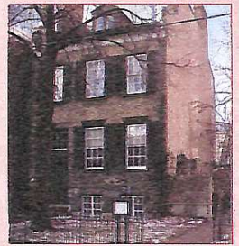
Дом Мэри Маккензи, 1840-50 г., Торонто

Если природа необходима человеку для его существования, то культурная среда — для его духовной, нравственной жизни, для привязанности к родным местам, следованию заветам предков. Культурная среда воспитывает нас незаметно для самих себя. Это тоже не подлжит ни малейшему сомнению. История, прошлое открывает окно в мир, и не только окно, но и двери, даже ворота — триумфальные ворота. Жить там, где жили великие поэты и прозаики, критики и философы, общественные деятели, впитывать впечатления от посещения квартир-музеев — значит обогащаться духовно. Газета "А+Б" предлагает читателям вместе с профессором Р.Ф. Руновой побывать в Канаде и на примере только одного дома середины XIX века увидеть, как там ценят культуру прошлого.