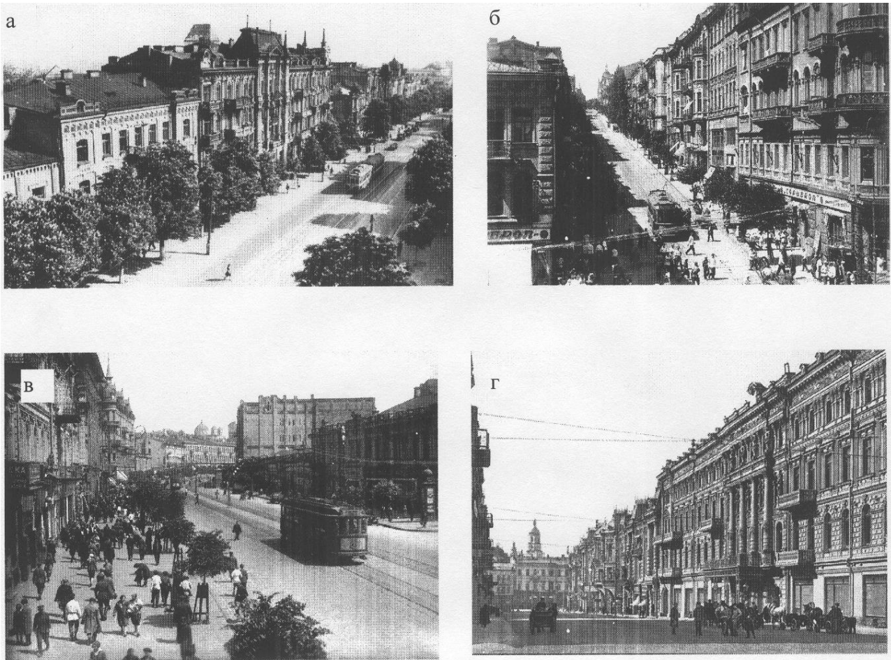
Рис. 1. Забудова Києва другої половини XIX – початку XX ст.: а – вул.Володимирська; б – вул.Прорізна; в – вул.Хрещатик; г – вул.Миколаївська.

Через розвиток монополістичного капіталу архітектура окремої споруди набуває рекламного характеру. Вона «кричить» про статки господаря. Чим більші статки, тим значніше постать в суспільстві, тим впливовіше її суспільна роль, яка підкреслюється не тільки фінансово, але й оточенням, сформованим відповідним розміром використаного простору, його предметно-речовим комплексом, його способом візуальної демонстрації у вигляді архітектурних форм, кольору, прийомів композиції, акцентуації на нові напрямки стилеутворення. Так виникає еkleктика, яка дозволяє відмовитися від законів формування певного стилю, в якій митці черпають найяскравіші, найвиразніші архітектурні деталі, прийоми формотворення, найактивніші співвідношення у кольоровій гамі. Архітектура через суспільно-економічні потреби набуває характеру різноманітності формотворення і стилеутворення. Єдиний стиль вже не є виразником естетичного ідеалу епохи, еталоном краси, навіть, певною «модою» епохи за визначенням окремих мистецтвознавців. Скоріше модою