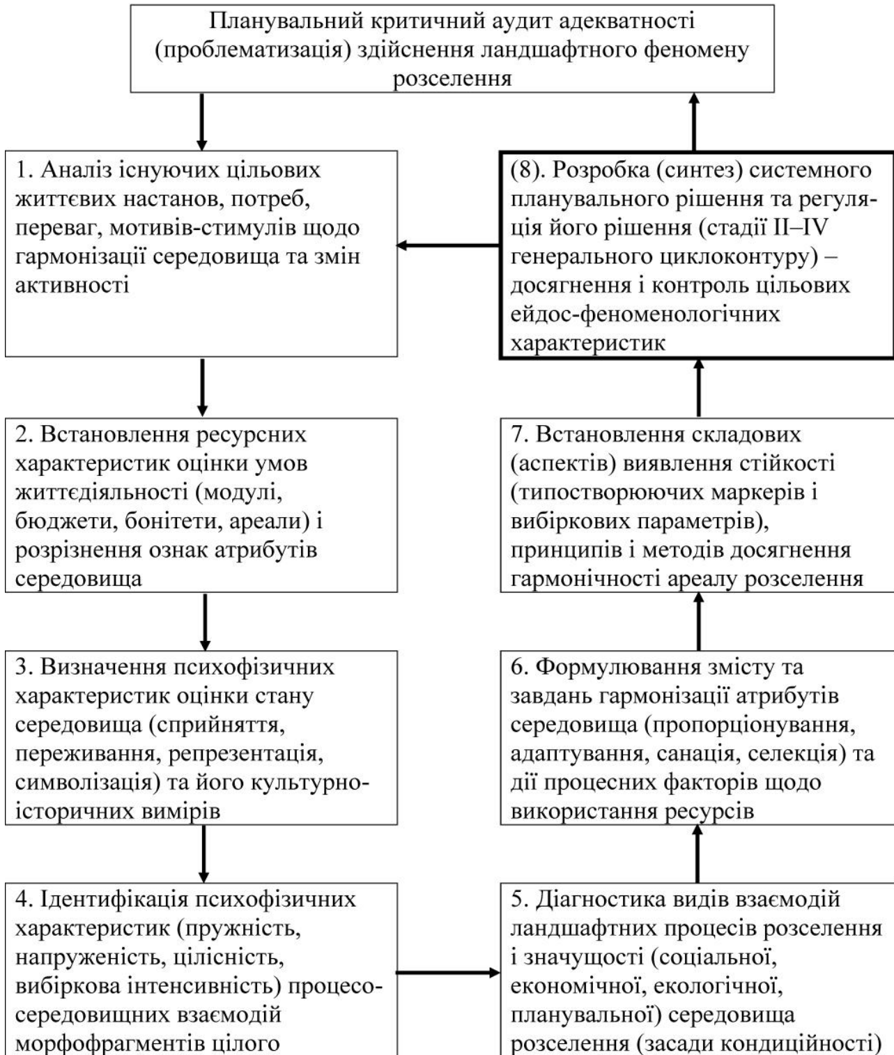
Рис.2 Змістовні етапи феноменологічної стадії розробки планувальних рішень поселень (стадія I рисунку 1)