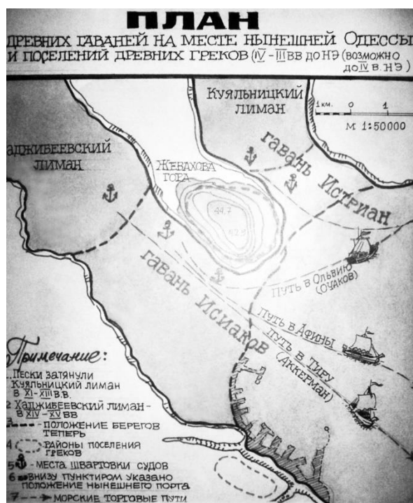
Рис. 3. План древних гаваней на месте нынешней Одессы (IV-III в. до н.э.)