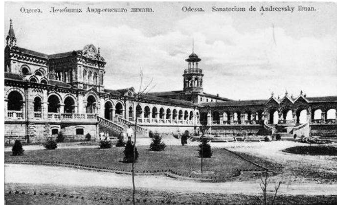
Рис. 2. Одесса. Лечебница Андреевского лимана (19 век)

Жевахова гора – объект археологических исследований. Однако история этих земель начинается задолго от развития промышленности Одессы, городских оздоровительных курортов на Андреевском лимане (ныне Куяльницкий) и князя Жевахова. До штурма Хаджибея казаки эту гору называли «Долгая Могила», а в V-IV в. до н.э. на горе находилось древнегреческое поселение, когда нынешние Куяльницкий и Хаджибейский лиманы соединялись с морем судоходными протоками (рис. 3).