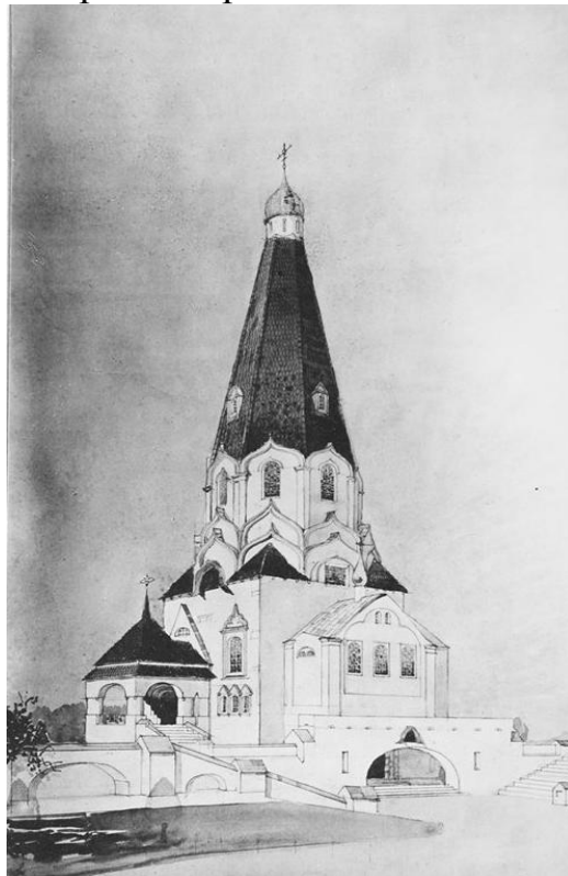
Рис. 1 – Проект храму-пам'ятника в ім'я Святого чудотворця Миколая на Звіринці у Києві. Загальний вигляд

Після жовтневого перевороту 1917 р., природно, відбуваються відмова від усього, що було пов'язане з християнством, та впроваджувалися зміни у сфері офіційної меморіальної культури. При цьому робиться спроба витиснення колишньої поховальної обрядовості, і заміна її новою. Пропагандується проведення кремації та будівництва крематоріїв. У 1920-1930-х роках були розроблені проекти крематоріїв для різних міст.