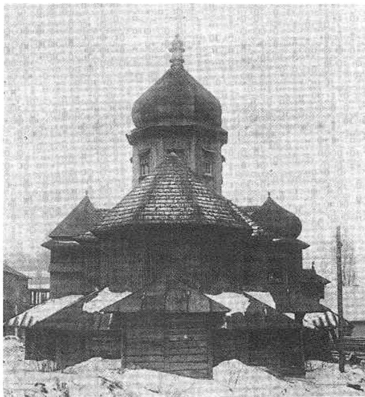
Рис. 3 – Дерев'яна греко-католицька церква у Києві. Загальний вигляд купола. Фото С.І.Притикіна, березень 1935 р.

Ще один храм у Києві став пам'яткою історії першої світової війни. Так, хід військових подій спричинили наплив до Києва численних полонених та біженців-українців з Галичини. Через це адміністрація міста мусила надати згоду щодо спорудження української греко-католицької церкви. Так, на Ново-Павлівській вулиці, на півдорозі до вул. Гоголівської та Обсерваторної у 1915-1916 роках на потребу вояків австрійської армії – галичан – була зведена греко-католицька (уніатська) церква. Це була невелика одно купольна дерев'яна церква XIX сторіччя покрита гонтом, яку розібравши, привезли з Галичини, зайнятої російськими військами, і знову звели у Києві [12]. Українці греко-католики ходили до неї і по війні, в 1920-х роках (рис. 3-4). Існують ще матеріали, які вказують на авторство проекту цієї церкви (1916) львівського архітектора Левинського І.І. (1851-1919). Під час війни в 1915 р. був заарештований російською окупаційною владою і серед інших заручників вивезений до Києва, де і брав участь у спорудженні греко-католицького храму [13]. У 1935 році церкву було знесено, а на місці її розташування влаштовано спортивний майданчик.