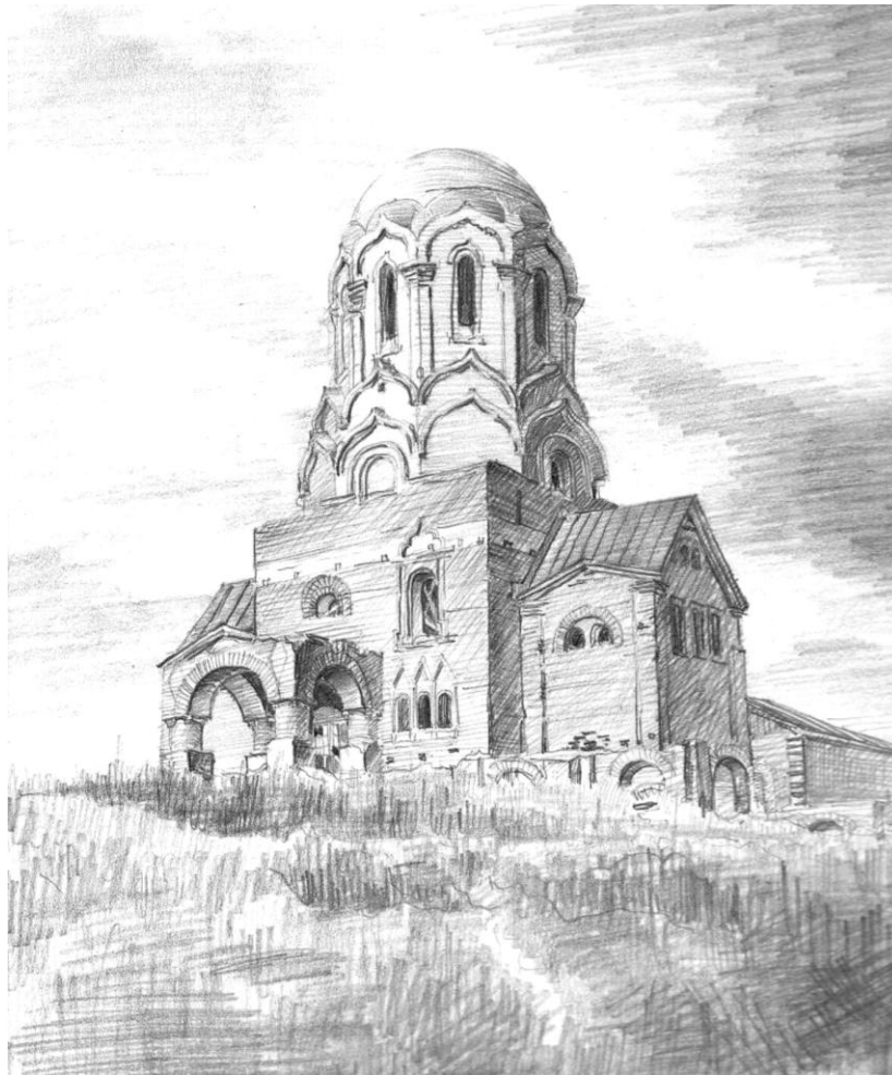
Рис. 2 – Недобудований храм-пам'ятник в ім'я Святого чудотворця Миколая на Звіринці у Києві. Рисунок В.А.Куцевича. Початок 50-х років ХХ ст.

У Москві на території Донського монастиря був відкритий перший крематорій. У кінці 1934-го року журнал «Соціалістичний Київ» інформував читачів про те, що в 1935 році буде упорядковано нове кладовище на Звіринці, а недобудований храм пропонувалося перетворити на крематорій. Але вже було не до того, оскільки Звіринець визначили місцем для створення Центрального ботанічного саду Академії наук УРСР. Під нього відводилося 117 га землі із будівлями Свято-Троїцького монастиря та приватною забудовою. Однак розроблення проекту зтягнулося, його затвердили лише в 1938 році (рис. 2).